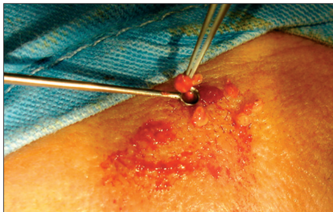
Figura 2 - Concreções após curetagem exaustiva