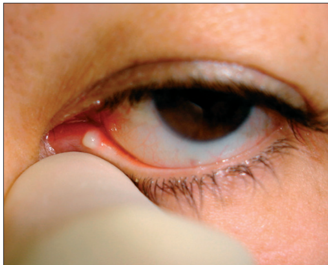
Figura 1 - Secreção purulenta e hiperemia no olho esquerdo

O tratamento cirúrgico consiste na realização de uma canaliculotomia que pode envolver ou não o ponto lacrimal. Em uma das técnicas é realizada uma incisão horizontal posterior do canaliculo com 5 a 8 mm de extensão, iniciando a 2 mm medialmente ao ponto lacrimal. Após a curetagem com cureta de calázio de 1 a 2 mm, realiza-se a entubação bicanalicular com