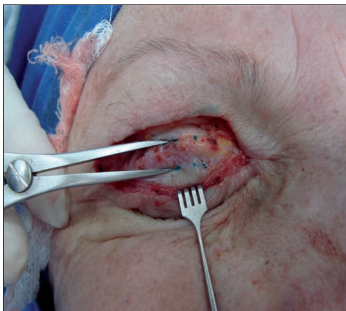
Figura 1 - Medida da distância entre a placa tarsal e a aponeurose do músculo levantador da pálpebra superior, referente a desinserção do referido músculo da placa tarsal

Nesta etapa utilizaram-se dois afastadores de pele do tipo garra, delicados, para afastar as bordas da ferida. Verificou-se se o tendão estava ou não desinserido e, em caso afirmativo, mediu-se com compasso cirúrgico a distância do mesmo até a margem tarsal, no centro da pálpebra. A leitura da medida foi efetuada por um auxiliar que não tinha conhecimento do exame pré-operatório e foi mascarada para o cirurgião. Fotografou-se o tendão. Observar desinserção da aponeurose do levantador da placa tarsal, a distância entre as duas estruturas está delimitada pelas extremidades do compasso cirúrgico (Figura 1). Na presença de desinserção, observou-se o músculo de Müller e a conjuntiva, no espaço existente até o tarso. Procedeu-se à fixação do mesmo com fio de seda 6-0 oftalmológico, com agulha espatulada (Ethicon, Johnson & Johnson), com pontos em "U", sendo que o primeiro foi passado na projeção do centro da pupila, com o paciente em posição primária do olhar. Foi solicitado ao paciente que abrisse a pálpebra, verificando-se a posição da mesma em relação ao eixo da pupila. Os ajustes foram feitos conforme o posicionamento obtido até que a posição palpebral fosse satisfatória. Procedeu-se às suturas complementares medial e lateral, com o mínimo de três pontos. Quando necessário, uma ou duas suturas extras foram feitas, no intuito de se obter uma curva