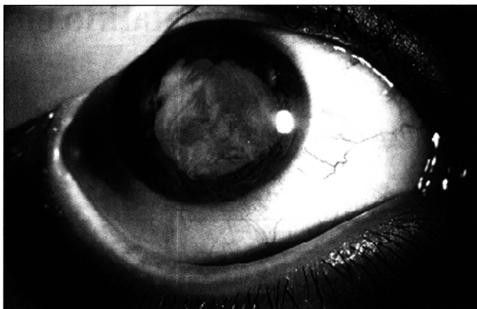
Fig. 1 - Presença de massas cristalínianas na câmara anterior do olho direito.