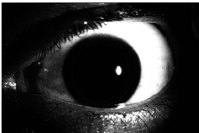
Fig. 2 - Lenticone anterior com ruptura central da cápsula anterior do cristalino do olho esquerdo.