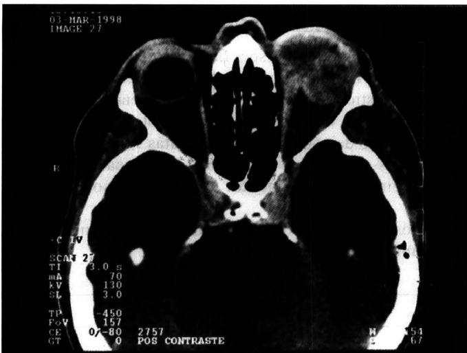
Fig. 2 - Corte tomográfico axial mostrando invasão orbital por carcinoma espinocelular de origem conjuntival. Indicação de exenteração total.

Das 23 cirurgias realizadas, 13 foram indicadas em casos nos quais os tumores eram facilmente diagnosticados e evoluíram durante longo tempo, antes de penetrarem na órbita. Esse grupo é representado, principalmente, pelos carcinomas baso e espinocelulares (CBC e CBE) palpebrais.