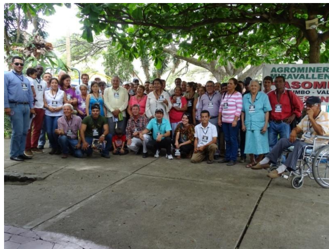
Figura 13- Asistentes del encuentro ciudadano llevado a cabo en Vijes el sábado 31 de octubre de 2015