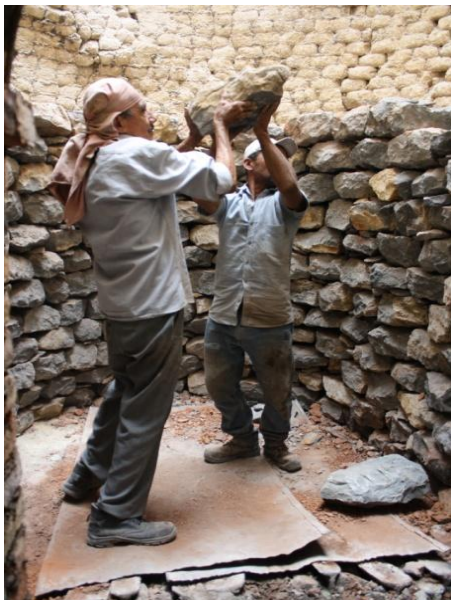
Figura 12 - El “peladientes”, práctica que revela la presencia del triángulo social de la civilidad en las labores de los artesanos que operan los hornos de colmena en Vijes

Dada la proximidad geográfica entre el pueblo y los lugares de trabajo, estas prácticas, en las que cobraba existencia el triángulo social de la civilidad mencionado por Sennett (2009), permearon y modelaron el conjunto de las relaciones y los intercambios sociales y dieron lugar a un fuerte tejido social que se conformó en el tiempo, en estrecha relación con las distintas actividades de la industria artesanal de la cal. Hoy en día, debido a la crisis de esa industria, ese tejido se ha desestructurado y desarticulado. Pero esta desarticulación no se debe solo a las graves tasas de desempleo que padece el municipio de Vijes y al hecho de que el poco empleo al cual pueden acceder los jóvenes esté fuera del pueblo, lo cual ha convertido a Vijes en un pueblo dormitorio, sino a un fenómeno muy difundido en Colombia, del cual es responsable la llamada clase política, que se denomina “cooptación del estado por parte de privados”, una de las vías más codiciadas en Colombia para el acceso a la riqueza. La gravedad de este fenómeno en Vijes ha agudizado los efectos de la crisis de la industria artesanal calera y ha generado entre la población indiferencia y apatía profundas, escepticismo y desmoralización generalizados.