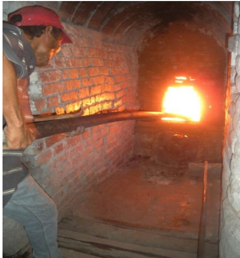
Figura 8 - Tubeado o palanqueado del horno