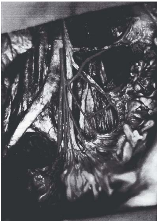
FIGURA 3 – Dissecação no cadáver nº 20. Sexo masculino