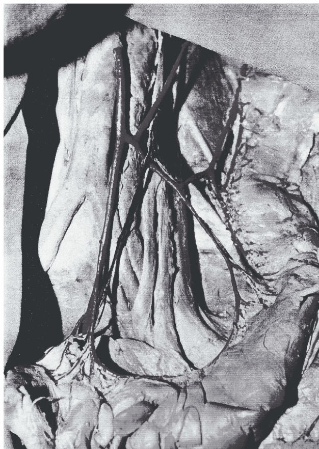
FIGURA 1 – Dissecção no cadáver nº 25

Observou-se que não houve relação entre o número maior de artérias sigmóideas com maior largura de mesocólon sigmóide.