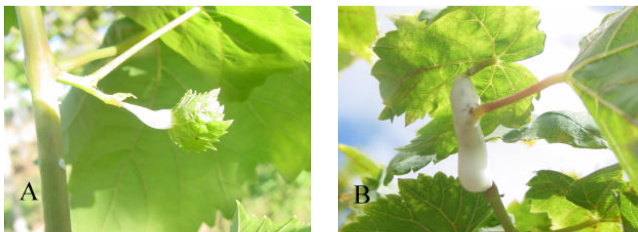
Fig. 3 - Caracterização dos danos e sintomas do ataque de Clastoptera sp. em pecíolos de ramos jovens (A) e velhos de videira (B), variedade "Itália".