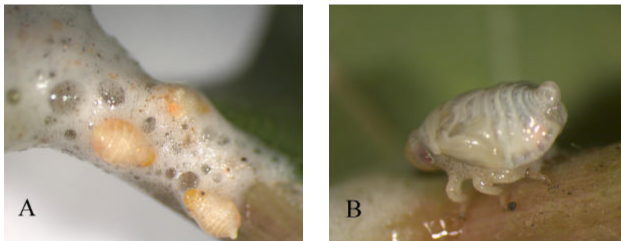
Fig. 2 - Clastoptera sp. A. Grupo de ninfas envolvidas pela massa de espuma; B. Ninfa se alimentando junto aos ramos da videira.