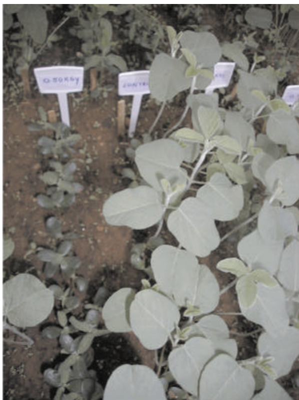
Fig. 3 - Detalhe do experimento com a soja para observação do desenvolvimento geral: à esquerda estão as plantas de sementes irradiadas com dose de 0,50 kGy; a direita estão as plantas - controle.