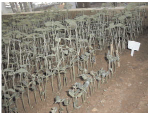
Fig. 4 - Detalhe do experimento com a soja para observação da altura das plantas: primeira cova da direita para a esquerda, dose de 0,50 kGy. Na segunda cova, dose de 0,20 kGy. A terceira cova é o controle.

Não foi possível realizar a determinação experimental da dose que mata 50% da população estudada ( LD_{50} ) para os valores de dose testados neste experimento.