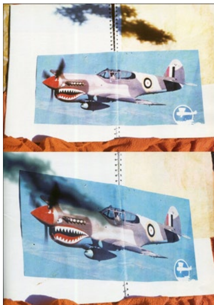
Figura 1: As mandíbulas do tubarão imperialista versus sombra chinesa de capim de caboclo, 1976.

capim caboclo, como se a natureza fosse a desgraça para a máquina. É essa a aventura de percurso que o babilaque , inicialmente, me mostra.