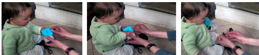
Figura 4 – M. puxa o livro afastando-o de sua mãe.