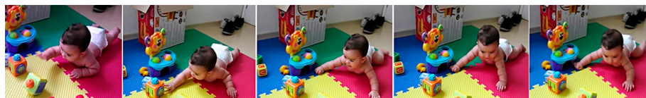
Figura 1 – V. tenta alcançar brinquedos (16-06-12 / 6 meses) 3