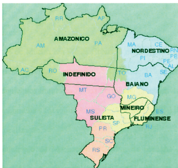
Figura 1 - Divisão dialetal do Brasil proposta por Antenor Nascentes. Há seis subfalares: Amazônico, Nordestino, Baiano, Mineiro, Fluminense, Sulista, além de um território indefinido

Desde 1953, quando Antenor Nascentes publica O linguajar carioca , se observa uma busca por uma caracterização dos diversos falares que constituiriam o português brasileiro. Segundo a divisão dialetal proposta por Nascentes, baseada na expressão das vogais médias pretônicas, o Espírito Santo comporia, juntamente com o Rio de Janeiro e com parte do leste de Minas Gerais, o subfalar Fluminense, conforme se verifica no mapa abaixo.