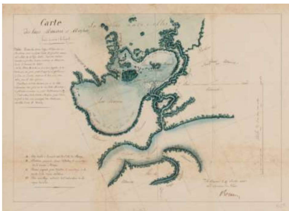
(α) Mapa dos lagos Macari e Amapá (com a ilha de Choisy onde foi construído o posto militar).

que ainda não havia nomeado os comissários para efetuar a demarcação dos limites. O governo do Brasil já havia nomeado seus comissários, mas julgava conveniente esperar a informação oficial de que o governo francês havia indicado os seus e que esses já estariam próximos a partir para a Guiana. 33 O texto do relatório do ano de 1841, referente à questão, é exatamente o mesmo do texto de 1840, o que significa que a situação não havia mudado. 34 Apesar de não haver nenhuma menção à questão com os franceses, porém, em 10 de julho de 1840 a evacuação do posto de Amapá havia sido efetuada 35 e em julho de 1841, com a intermediação da Grã-Bretanha, ou, segundo Ponte Ribeiro, com a pressão dos ingleses, ficou acordada a neutralização do território contestado entre o Brasil e a França. 36