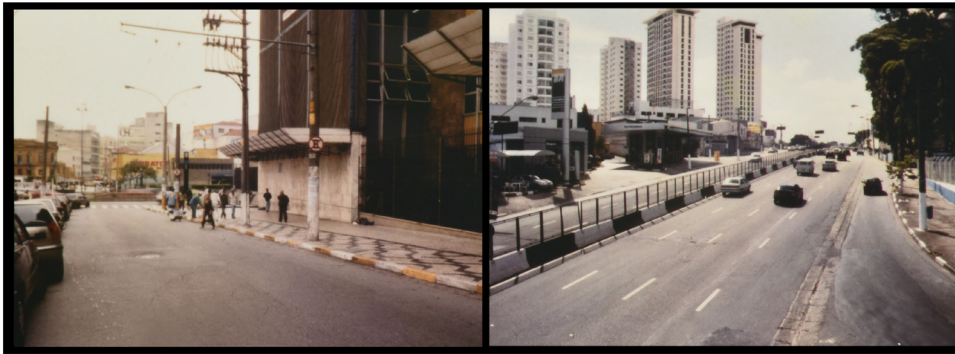
RUA WASHINGTON LUÍS CENTRO, SP AVENIDA WASHINGTON LUÍS AEROPORTO, SP