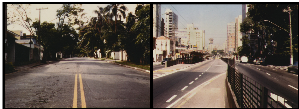
RUA 9 DE JULHO SANTO AMARO, SP AVENIDA 9 DE JULHO JARDINS, SP

Ressalve-se que a obra de Militão de Azevedo será apresentada de modo sumário, apenas para garantir inteligibilidade a um público maior. Será enfatizado, quando necessário, o percurso de sua difusão e recorrência ao longo do tempo, pontuando-se enfaticamente ações mobilizadoras que, caso expressivo no quadro brasileiro, revelam modos de agenciamento sobre temporalidade.