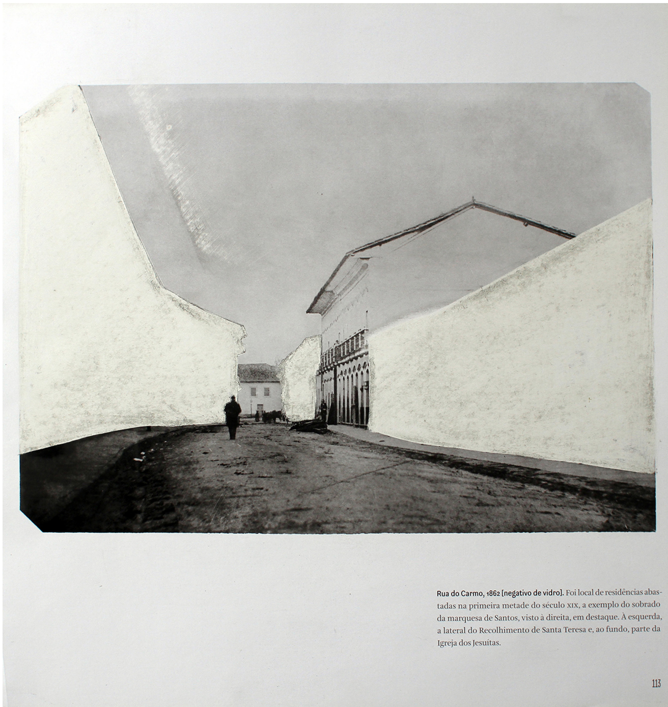
Rua do Carmo, 1862 [negativo de vidro]. Foi local de residências abastadas na primeira metade do século XIX, a exemplo do sobrado da marquesa de Santos, visto à direita, em destaque. À esquerda, a lateral do Recolhimento de Santa Teresa e, ao fundo, parte da Igreja dos Jesuítas.