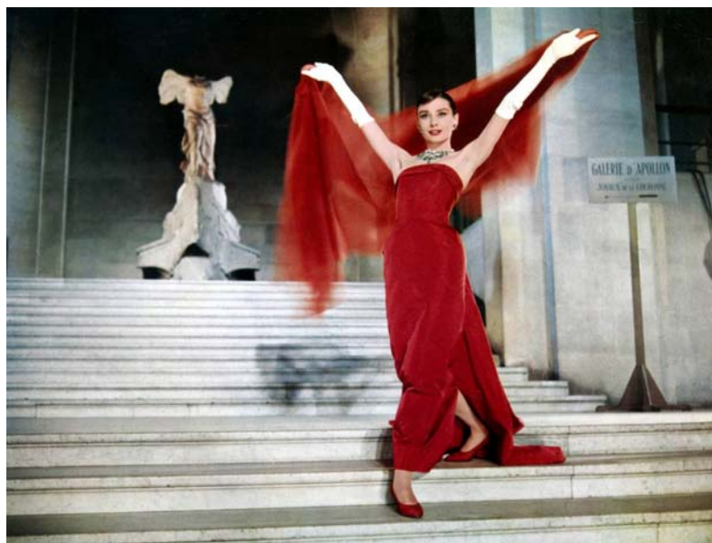
Figura 2: Audrey Hepburn em cena do filme Cinderela em Paris [Funny Face, Dir. Stanley Donen, 1956, 103 min, cor]