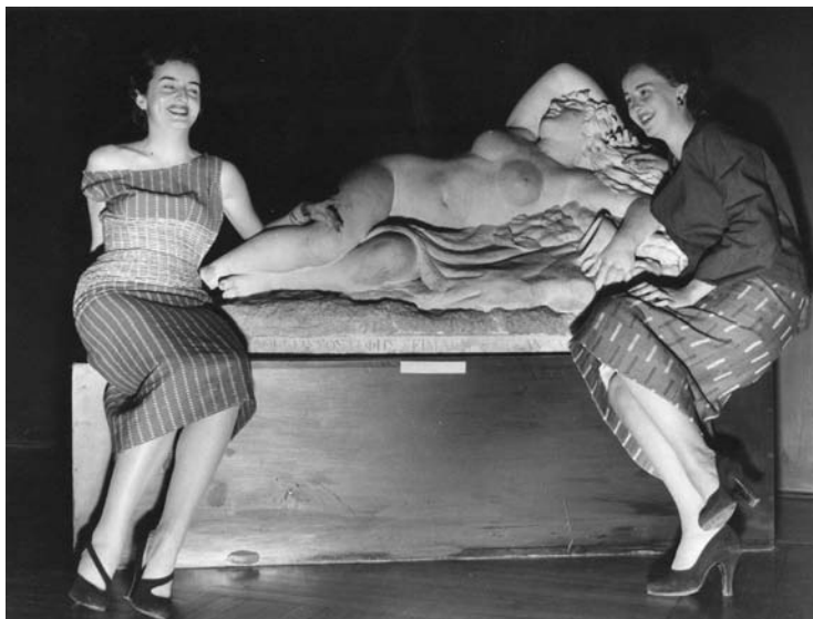
Figura 6: Duas modelos brasileiras com trajés elaborados nas oficinas do MASP para a Coleção “Moda Brasileira” (1952) posando diante da “Bacante adormecida” de Valério Vilarealle, 1833.

Dior, Bardi tenha atuado dentro da premissa do Sindicato Nacional Fascista de Belas-Artes – que pautava, aliás, as exposições que organizou para a Galeria de Arte de Roma -, o qual entendia que levar para a Itália exposições de artistas estrangeiros já estabelecidos colaboraria no desenvolvimento do campo da arte italiana.