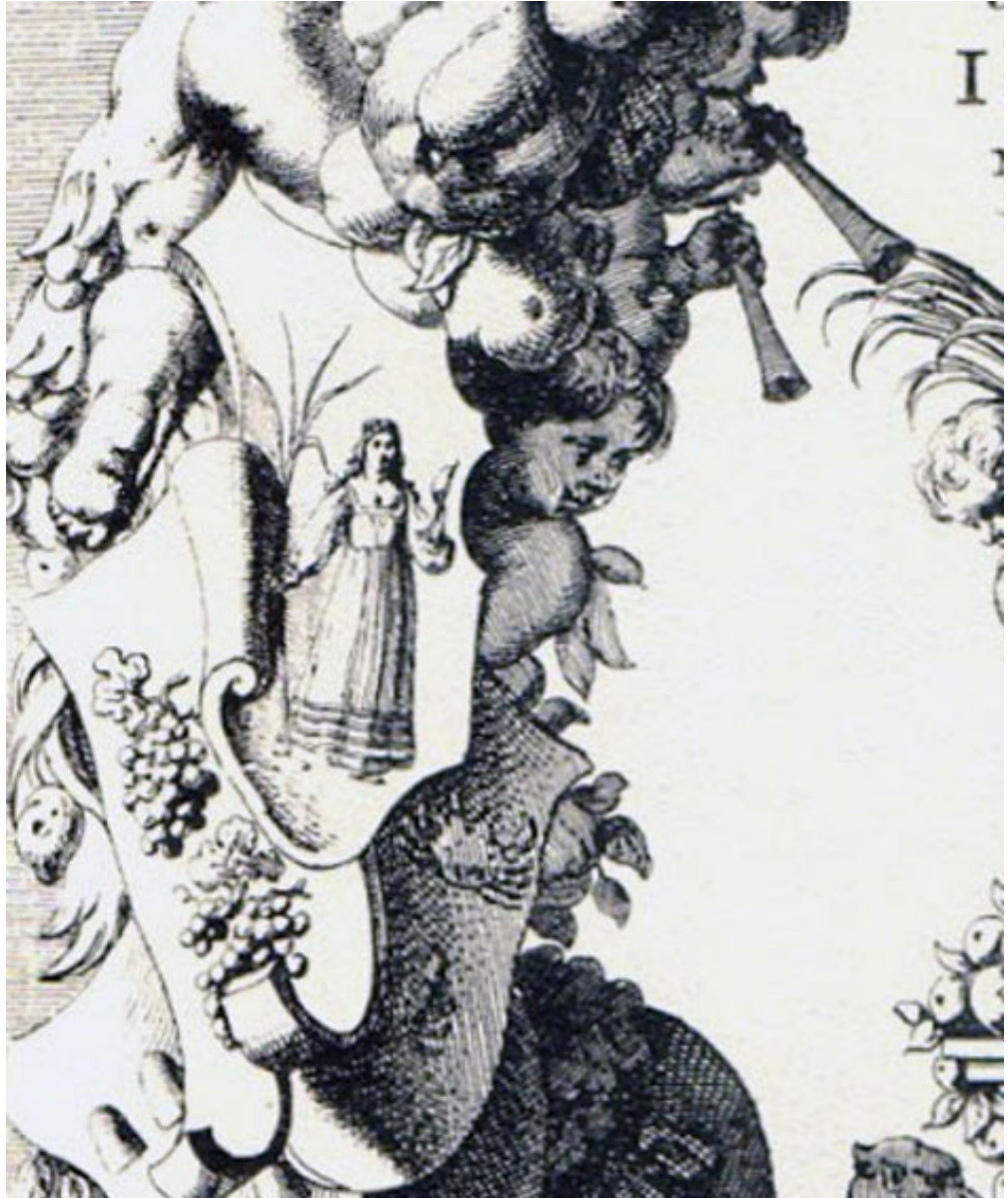
Figura 4 – Detalhe dos escudos. 43

Os lauréis que, na parte superior, encerram no centro os leões, quiseram assim aludir ao seu titular: