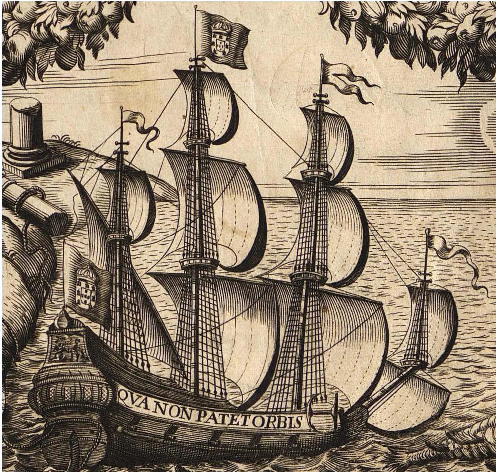
Figura 2 – Detalhe da embarcação no frontispício do livro Nova Lusitânia . 37

Poucas são as vezes que encontramos uma indicação tão explícita quanto ao uso de uma imagem em um frontispício. Brito Freyre menciona que a gravura faz “rosto” ao seu argumento. Lembremos que frontispícios também eram chamados de páginas de rosto, derivando para nossa atual folha de rosto. A relação com uma parte do corpo humano também aparece na definição de Bluteau, que afirma que