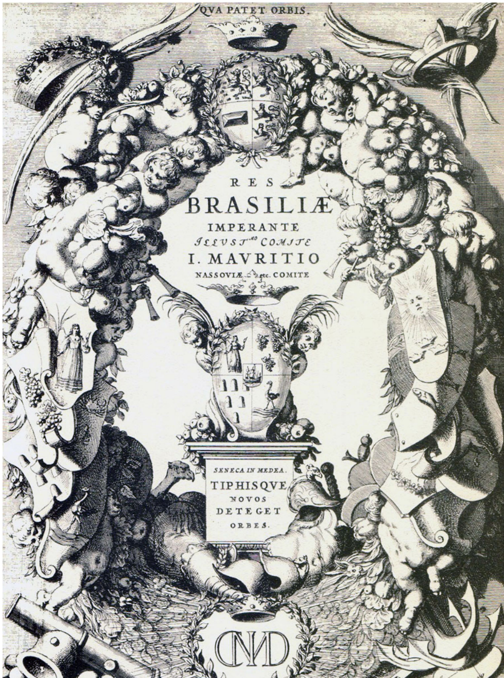
Figura 3 – Frontispício do livro Rerum per Octennium in Brasilia , de Gaspar Barléu. 42