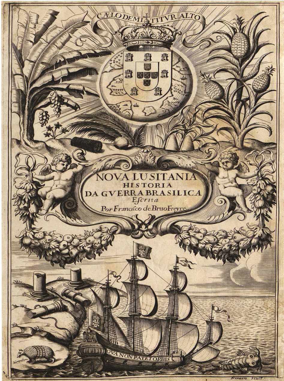
Figura 1 – Frontispício do livro Nova Lusitânia , de Francisco de Brito Freyre. 32