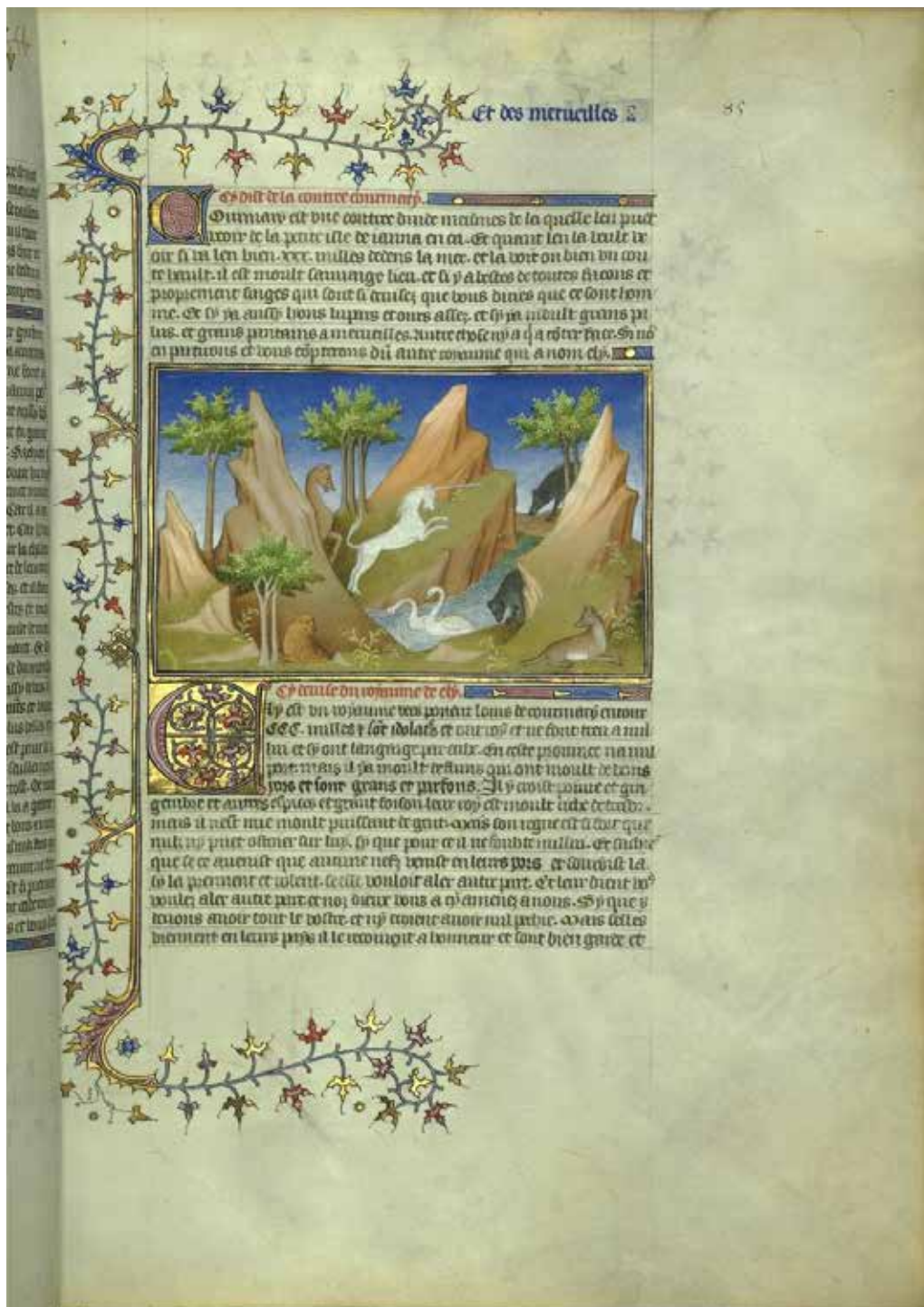
Figura 1. Marco Polo, Livre des merveilles . Bibliothèque Nationale de France. Département des Manuscrits. Français 2810. Domínio público. Disponível em: < https://bit.ly/346jf1D >.