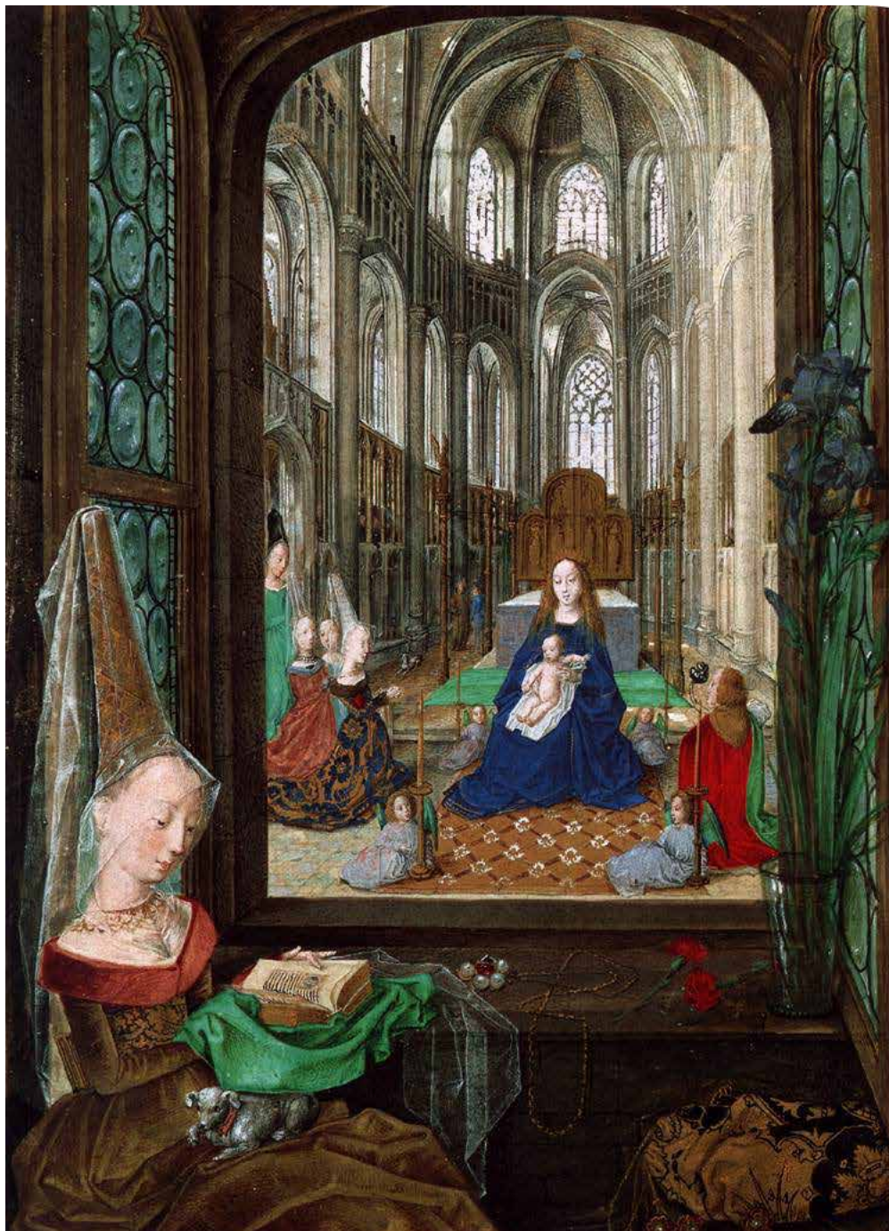
Figura 2 – Mulher rezando diante do livro. Livro de Horas de Maria da Borgonha , fólio 14 verso. Acervo da Österreichische Nationalbibliothek, Viena (Áustria), Codex Vindobonensis 1857.