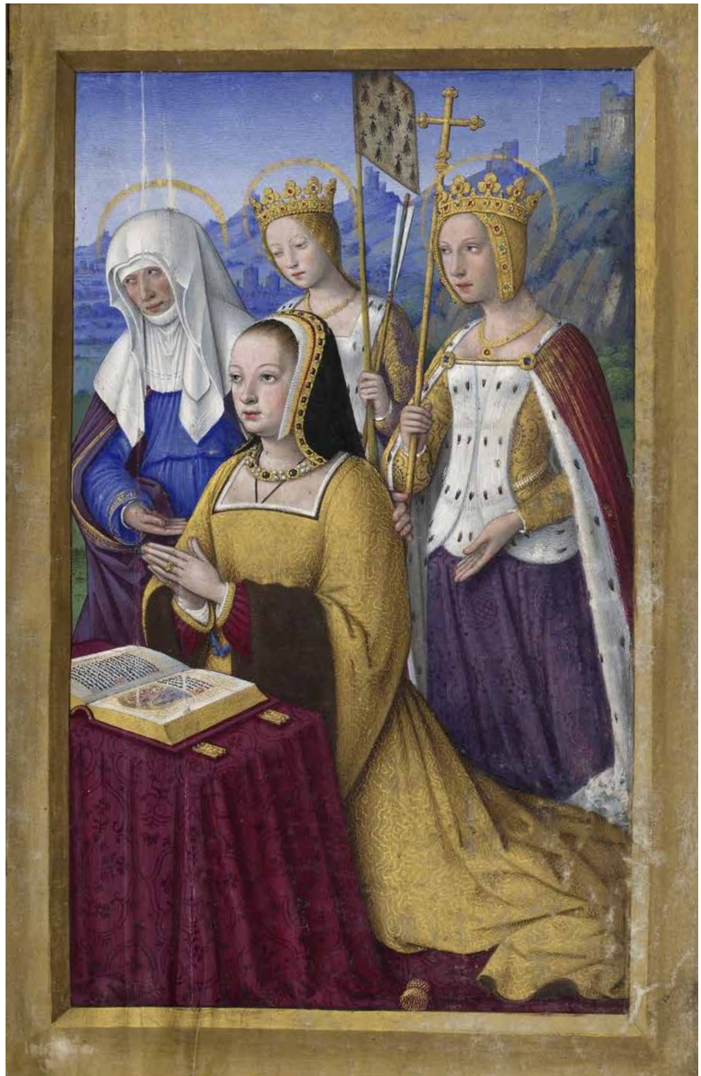
Figura 3. Mulher rezando diante de um livro de horas. Horae ad usum Romanum, ditas Grandes Heures d'Anne de Bretagne (1505-1510). Acervo da Biblioteca Nacional de França. Domínio Público.