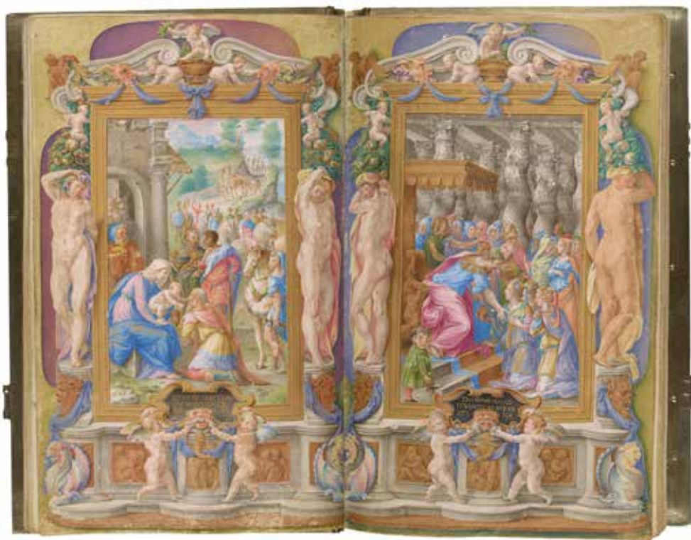
Figura 5. Horas de Farnese . Officio di Giulio Clovio dedicate all'Eccellentissimo Cardinale Farnese 1546. The Morgan Library & Museum, MS M.69, Domínio público. Disponível em: < https://bit.ly/2R5GVhq >.

Na França, os principais centros produtores foram Angers, Tours, Bourges, Borgonha e, sobretudo, Paris. A pintura francesa do século XIV se caracteriza por um design de página com bordaduras leves preenchidas com delicados ramos de folhas trilobadas, mantendo grandes áreas livres de pintura. 35 As vinhetas de fim de página apresentam cenas nas quais os personagens são mais importantes do que o cenário arquitetônico ou natural. No início do Quatrocentos já se percebe um gosto maior pela abundância de elementos decorativos nas cercaduras, chegando à metade do século com a incorporação de motivos mais exuberantes e de maior porte, como os acantos coloridos e as pinturas de vasos e flores, em uma evidente incorporação do gosto flamengo. Mas há duas características constantes na pintura feita na França ou para clientes franceses: o fundo da iluminura construída em mosaicos de figuras geométricas coloridas em azul, dourado e vermelho e a presença das flores de lis como elemento decorativo. 36 Embora seja possível perceber características regionais na escolha dos motivos ornamentais, o trânsito dos profissionais em busca de trabalho promovia a circulação dos estilos e a internacionalização dos padrões. A iluminura flamenga