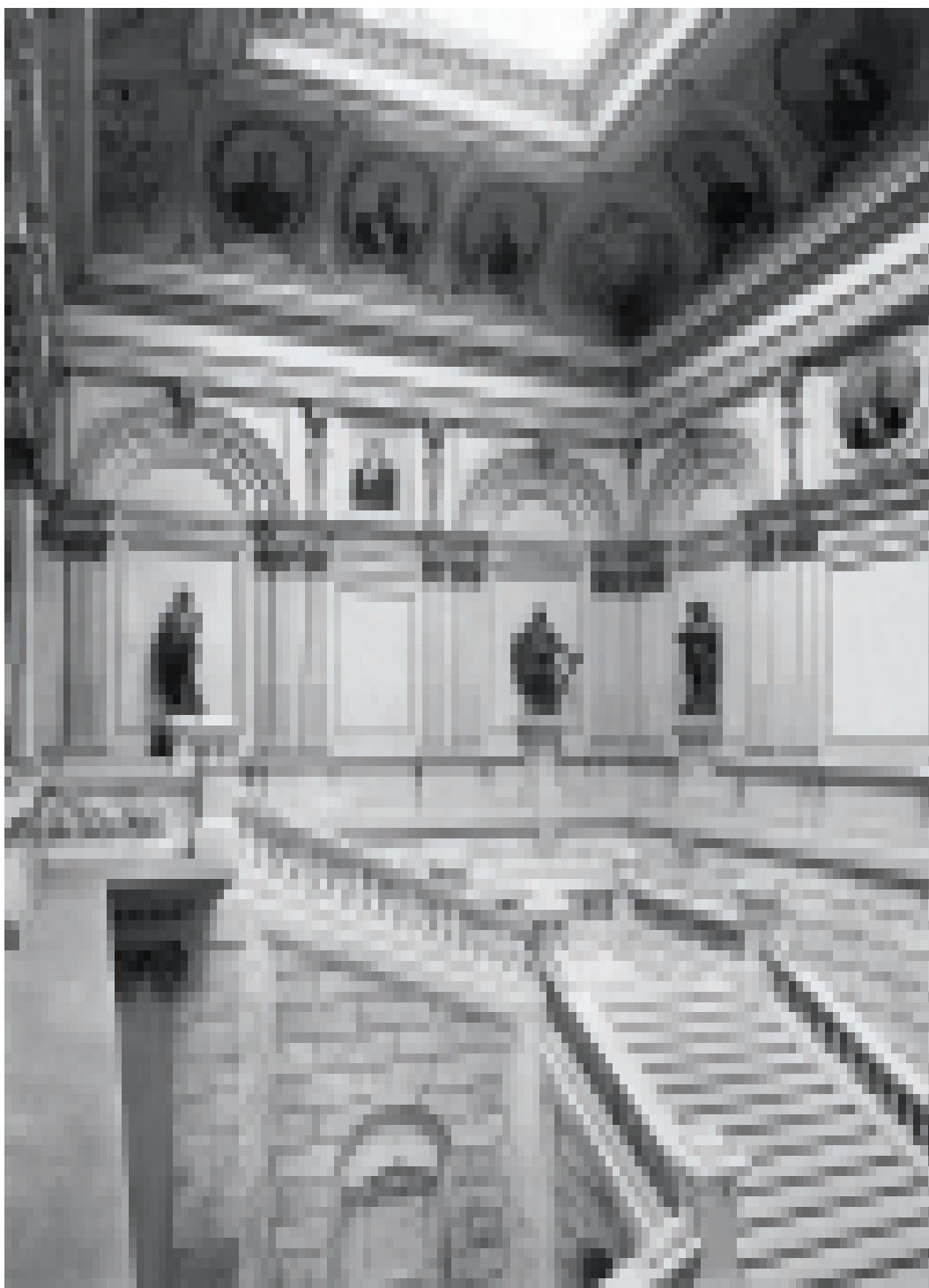
FIGURA 3 – Escadaria monumental do Museu Paulista com a decoração incompleta, c. 1920, negativo de vidro.