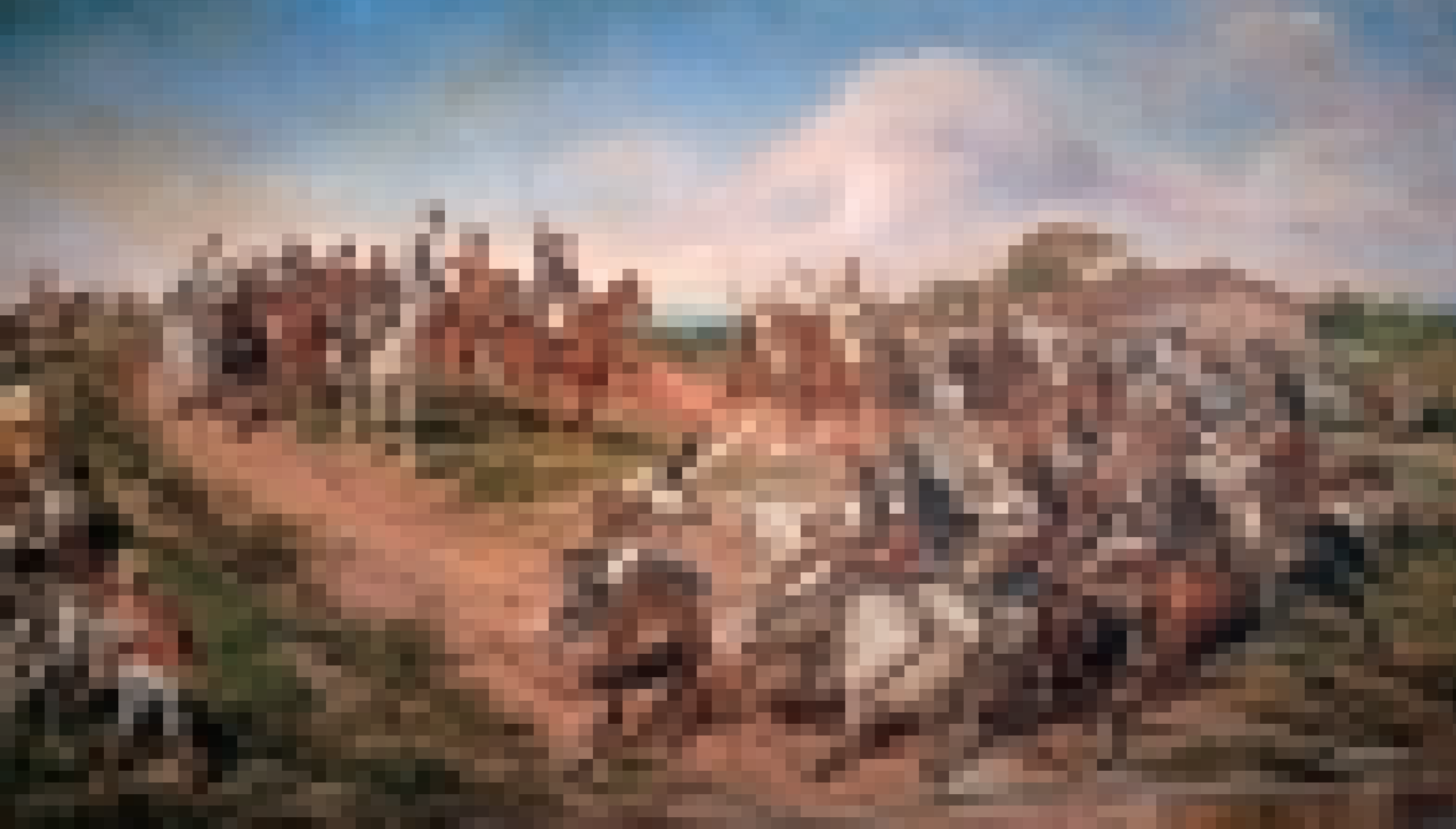
FIGURA 6 – Pedro Américo. Independência ou Morte, 1888, óleo sobre tela, 4,15x7,60m. Encomenda do Governo Imperial ao pintor, executada em Florença. Acervo Museu Paulista da USP. Reprodução de João Sócrates de Oliveira.