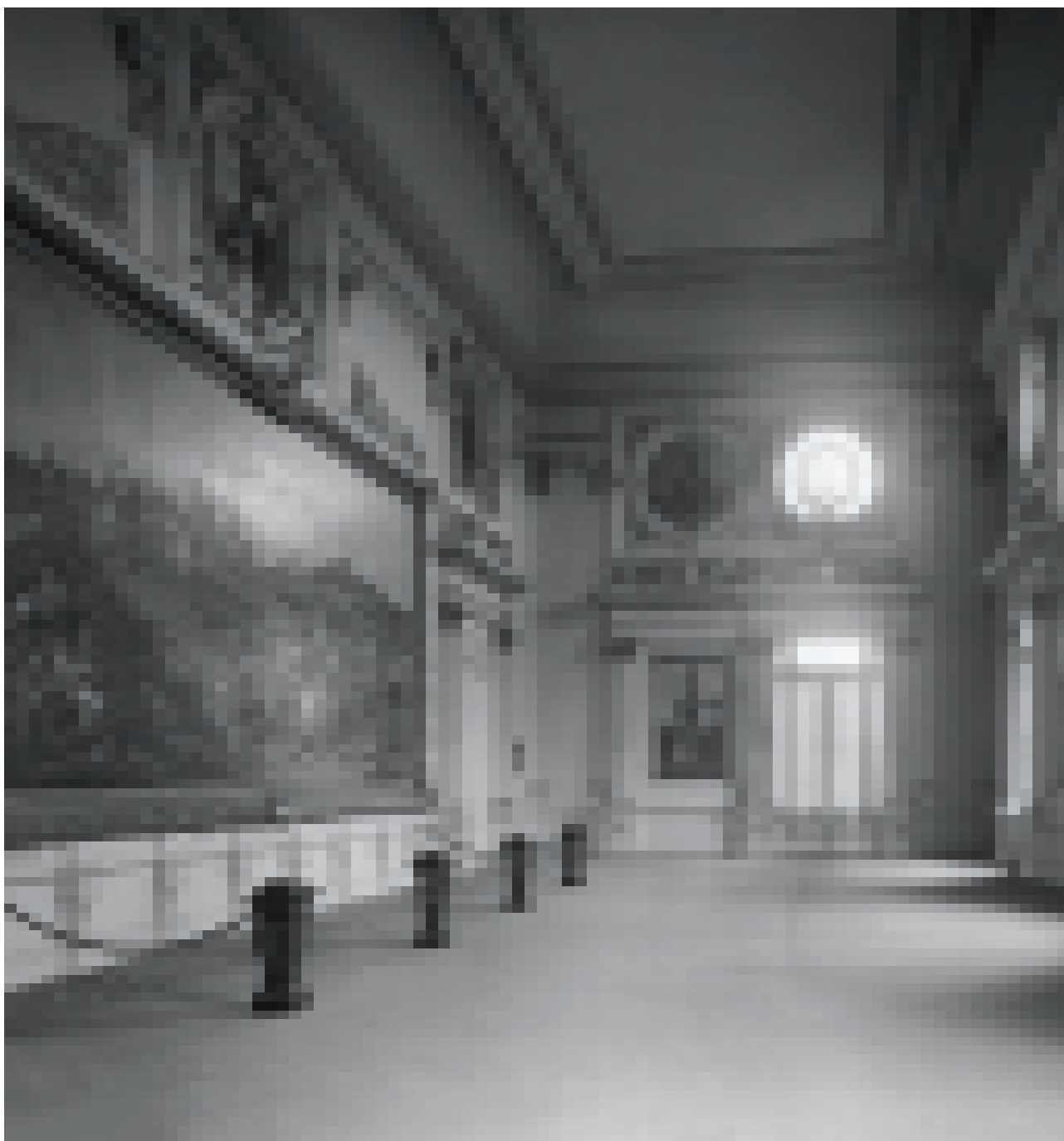
FIGURA 4 – Salão Nobre do Museu Paulista na década de 1920, negativo de vidro. Acervo Museu Paulista da USP. Cópia-contato de José Rosael.