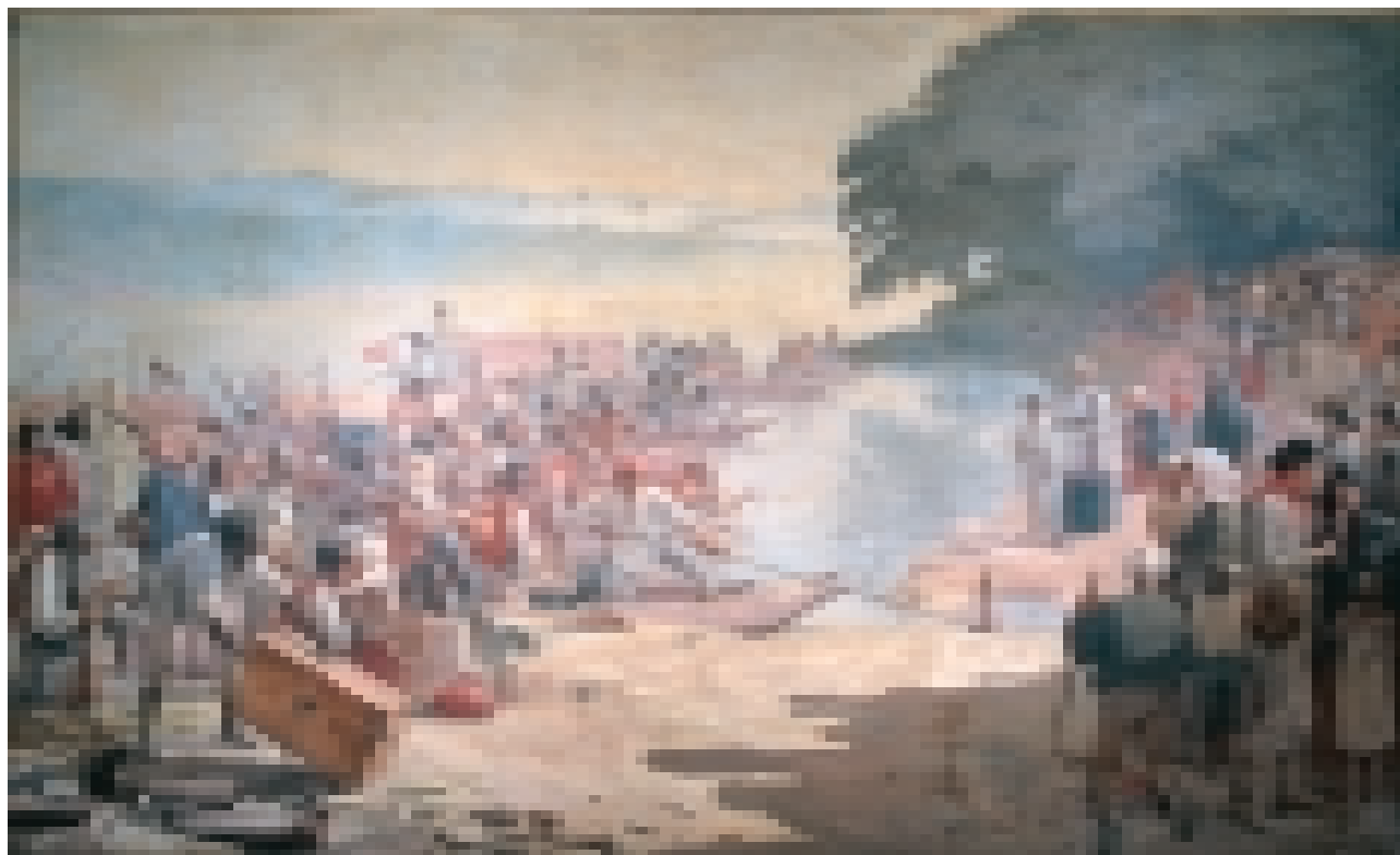
FIGURA 7 – Almeida Júnior. A Partida da Monção, 1897, óleo sobre tela, 390 x 640 cm, São Paulo. Inspirado em desenhos de Hercules Florence. Acervo Museu Paulista da USP.