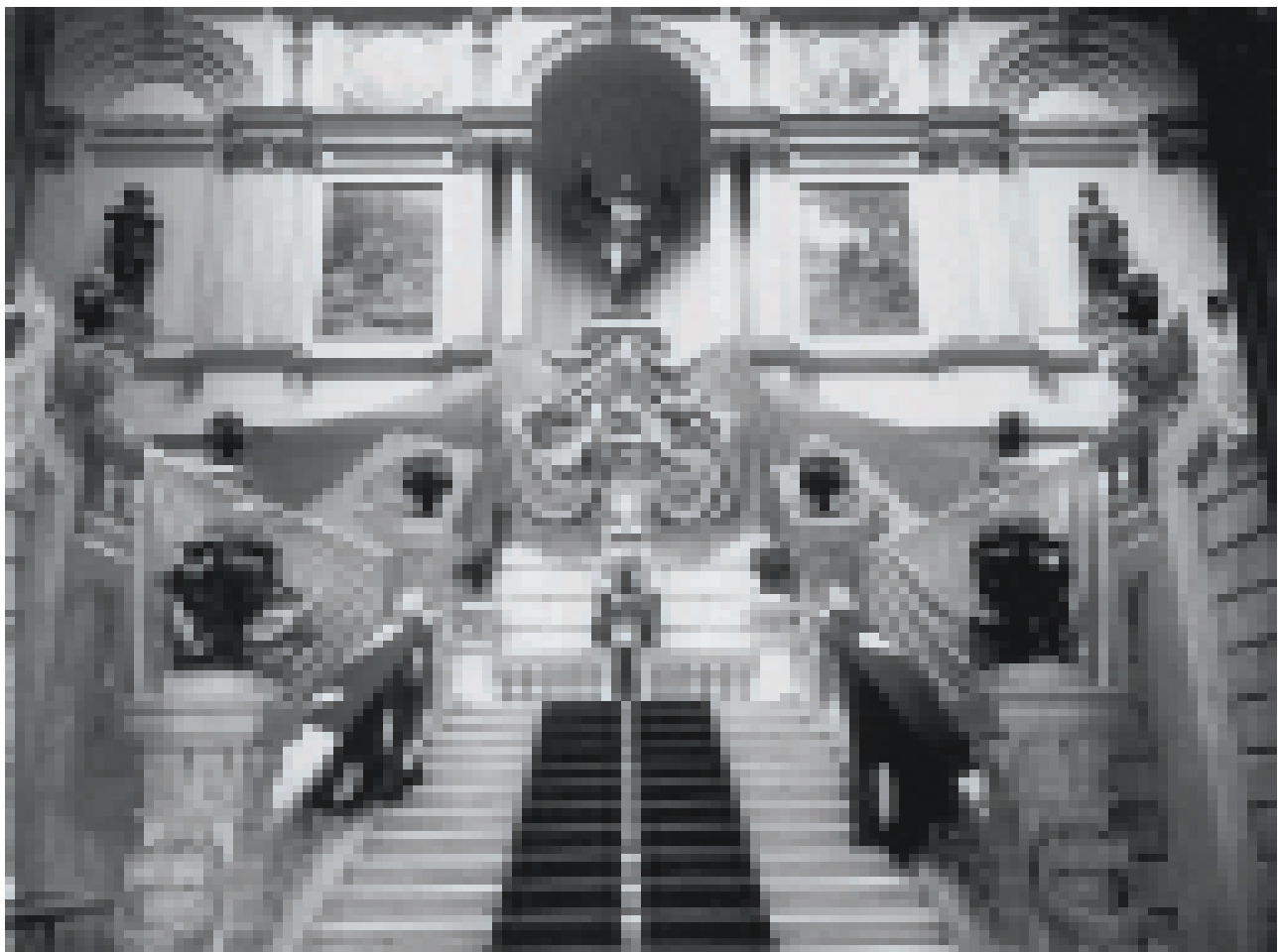
FIGURA 1 – Escadaria monumental vista a partir do hall de entrada do edifício do Museu Paulista na década de 1930, com a estátua de D. Pedro I ocupando o nicho central da escadaria, negativo de vidro.