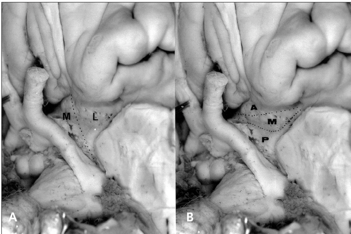
Fig 2. A) Divisão dos segmentos medial (M) e lateral (L) da substância perfurada anterior basal; B) Divisão dos segmentos anterior (A), médio (M) e posterior (P) da substância perfurada anterior basal.

70,7% desses ramos à SPA. Observamos que quanto mais precoce maior o número de perfurantes no segmento pós-divisão. Verificamos ramos precoces em 35,7% dos hemisférios analisados destes, 80% eram dirigidos ao lobo temporal (incluindo a ínsula) e 20% ao lobo frontal. Em 14,3% enviaram pelo menos um ramo à SPA. Sua origem foi a superfície ântero-superior da ACM. Foi identificada uma ACM acessória no