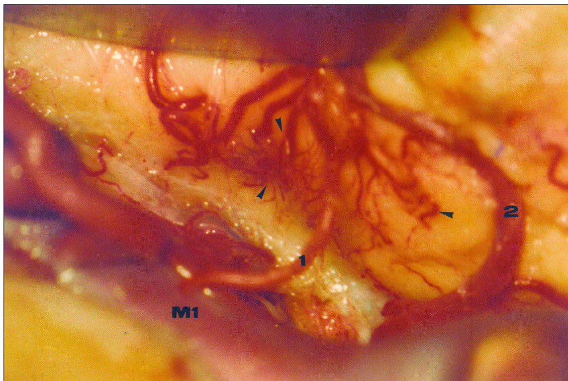
Fig 3. Regi3o do lobo temporal de anastomoses leptomen3ngeas entre um ramo precoce (1) do primeiro segmento da art3ria cerebral m3dia (M1) e um ramo temporal (2) da art3ria cor3idea anterior, indicada pelas cabe3as de seta.