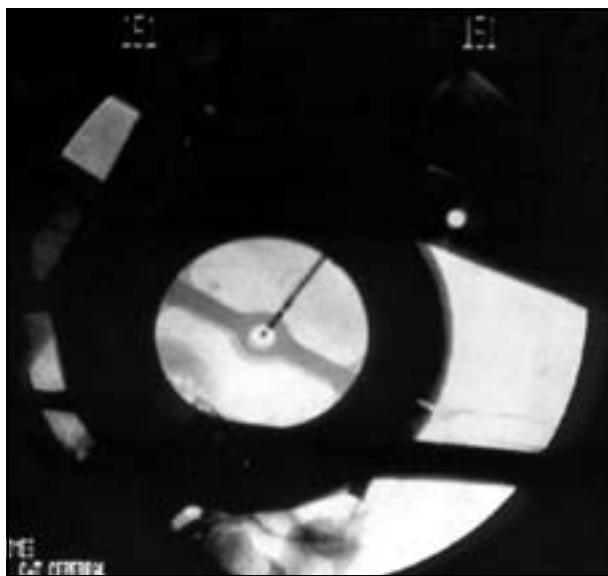
Fig 1. Fluoroscopia intraoperatória comprovando o correto posicionamento do eletrodo no alvo (núcleo VIM talâmico) após fixação do eletrodo quadripolar.

Todos os pacientes foram submetidos à imagem por ressonância no pós-operatório confirmando o posicionamento do eletrodo, antes de fazer a programação (Fig 2).