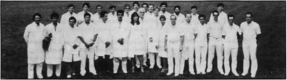
Figura 2. Integrantes do MM-2 (1983).