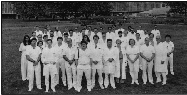
Figura 5. Integrantes do MM-5 (1989).