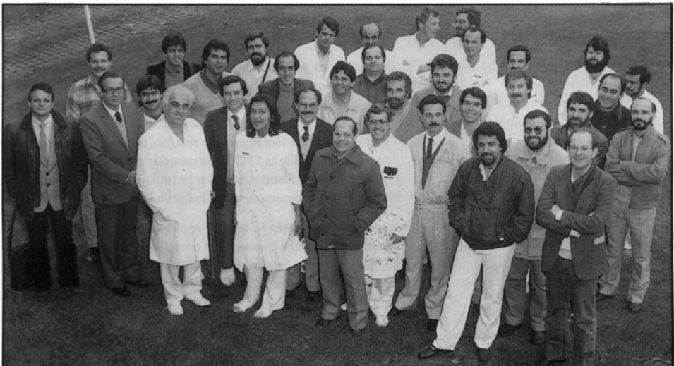
Figura 3. Integrantes do MM-3 (1985).