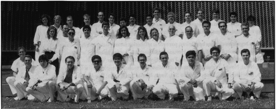
Figura 6. Integrantes do MM-6 (1993).