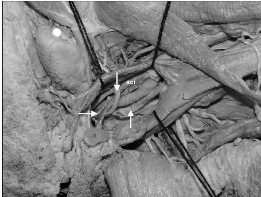
Fig 3. Imagem de disseção anatômica realizada em nosso laboratório evidenciando a íntima relação dos nervos cranianos glossofaríngeo (seta à esquerda), vago (seta à direita), e hipoglosso (seta superior) com a artéria carótida interna (aci).

frequente, estando ou não associado a outros nervos cranianos 1 . No caso em questão, houve o envolvimento do IX, X e XII nervos cranianos, associação pouco descrita.