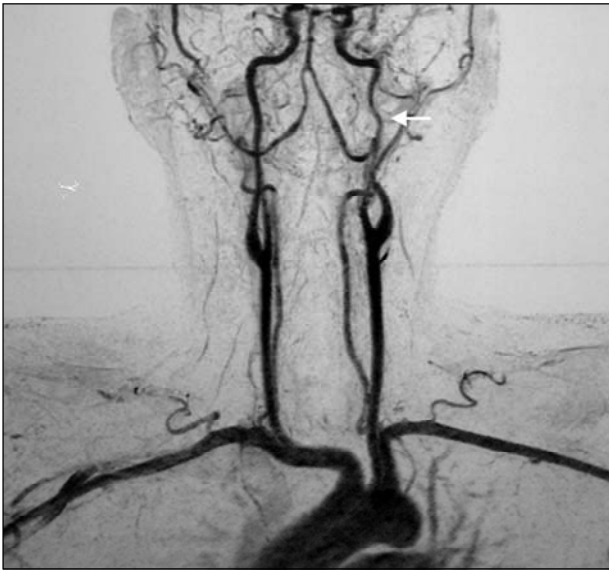
Fig 1. Angiorressonância cervical evidenciando dissecção da porção cervical ascendente da artéria carótida interna esquerda (seta).

hemicrânio esquerdo, disfonia, disfagia para sólidos e líquidos e dificuldade de movimentar a língua. O paciente não possuía fatores de risco para doença cérebro-vascular. Ao exame físico, presença de alterações dos nervos cranianos IX, X, e XII, compatíveis com os sintomas apresentados. Ausência de déficit motor nos membros e de reflexos patológicos. A angiorressonância magnética arterial com gadolínio da região cervical e encéfalo evidenciou dissecção da porção cervical ascendente do segmento C1 da artéria carótida interna esquerda, sem extensão para os segmentos intracranianos do vaso (Fig 1). A dissecção determinava estenose parcial da luz do vaso com irregularidades de seus contornos. A ressonância magnética (RM) do encéfalo, nas seqüências com pulso de saturação de gordura, evidenciou trombo intramural excêntrico, de forma espiralada, com crescimento predominantemente subadventicial (Fig 2). A angiografia digital cerebral confirmou o diagnóstico de dissecção de artéria carótida esquerda.