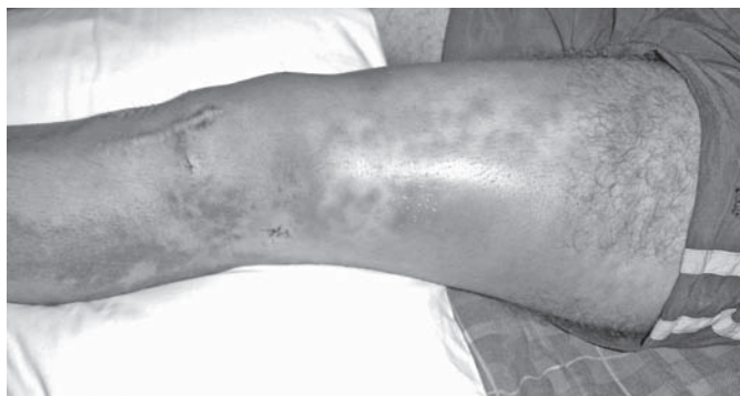
Figura 1 – Membro inferior direito demonstrando o extenso hematoma na face lateral do joelho e coxa.

Onze dias após a cirurgia o paciente foi atendido com história de estalido seguido de dor aguda na face lateral do joelho próximo a incisão para passagem do parafuso transverso. Apresentava palidez cutâneo-mucosa (+++) e edema tenso na face lateral da coxa com hematoma que se estendia até a face posterior do joelho. (Figura 1) Exame ultrassonográfico com Doppler revelou hematoma extenso (cerca de 1100 ml) na coxa e um pseudoaneurisma de artéria genicular lateral superior.