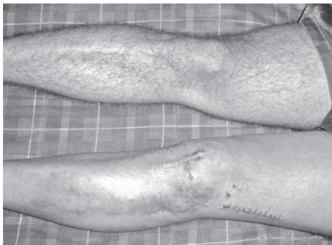
Figura 2 – Fotografia dos membros inferiores demonstrando a cicatriz cirúrgica no pós-operatório da ligadura da artéria genicular superior lateral.

Realizada drenagem cirúrgica do hematoma e a ligadura da artéria genicular lateral superior que apresentava lesão parcial em esgarçamento. Na avaliação pós-operatória o hemograma revelou hemoglobina de 8,2 mg/dl (hemoglobina pré-operatória de 12,2 mg/dl). O paciente recebeu uma unidade de concentrado de hemácias e recebeu alta hospitalar no dia seguinte. (Figura 2) Apesar da intercorrência o paciente evoluiu muito bem, com segurança no joelho. O paciente retornou ao mesmo nível de atividade física praticada antes da lesão do joelho demonstrando-se satisfeito com a cirurgia.