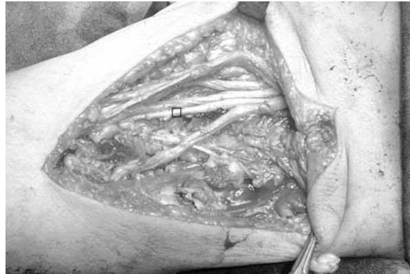
Figura 3 - Exposição dos elementos da plexo braquial após ressecção. Marcador sobre a artéria braquial.

considerando a baixa taxa de recorrência mesmo para ressecções incompletas.