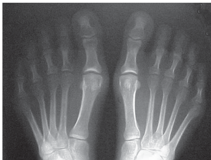
Figura 2- RX pré operatório.