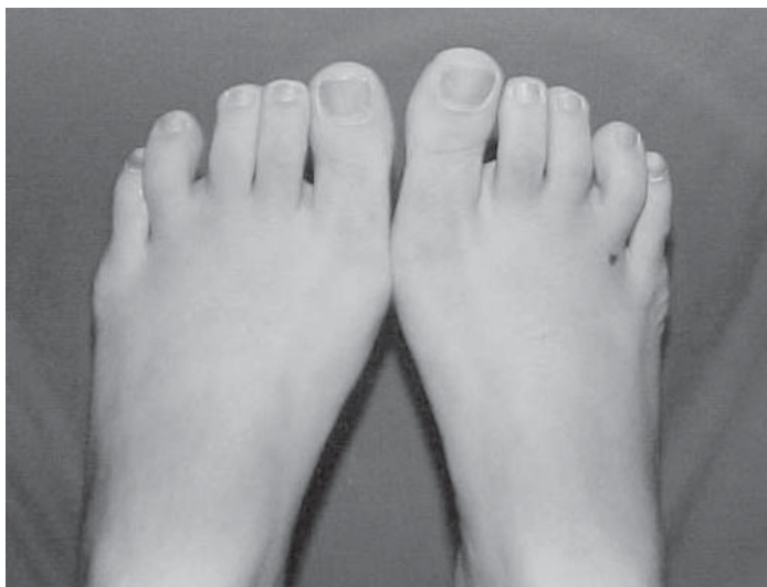
Figura 1- Aspecto clínico

Os achados clássicos da AR no antepé são halux valgo com grande comprometimento articular tipo degenerativo e sinovite das articulações metatarso-falângicas dos dedos menores, com luxação dorsal irreduzível. São sinais precoces na AR e evoluem para metatarsalgia por compressão das cabeças metatarsais no coxim gorduroso do antepé contra o solo (3) . Grandes bursas são encontradas nos espaços intermetatarsais distais e ocasionalmente sob o halux (1) .