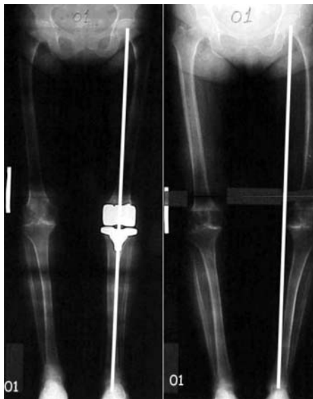
Figura 4 - RX panorâmico do pré e pós operatório do primeiro caso operado com o OrthoPilot .

O OrthoPilot é o sistema de navegação para ATJ com o maior número de casos clínicos e as maiores séries publicadas na literatura internacional (11,17) , sendo esta a primeira série em nosso meio. Na literatura internacional a primeira série, com 30 joelhos, foi publicada em 2001 por Mielke et al. (20) . Assim iniciamos