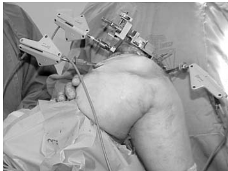
Figura 1 - Corpos rígidos com transmissores de infra-vermelho acoplados ao fêmur distal, tibia proximal e guia de corte femoral.

O desvio médio do eixo mecânico nulo foi de 0,66° com desvio padrão de 0,7°, sendo que 98,6% dos joelhos ficaram dentro de uma margem de erro de 3° e 79,2% com erro inferior a 1°. O erro variou de 3,4° de varo a 2,7° de valgo. Se analisarmos os primeiros 20 joelhos, de 19 pacientes, o desvio médio foi de 0,72° com desvio padrão de 0,96°, 95% dos casos com erro inferior a 3° e 80%