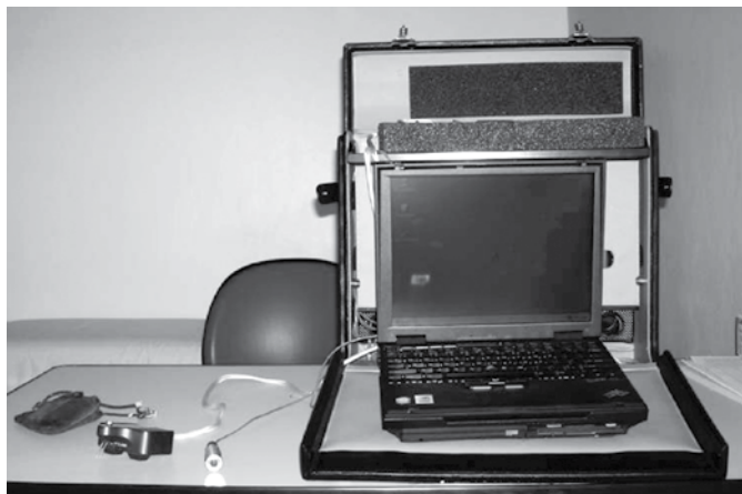
Figura 2. Visão geral do PSSD: Da esquerda para a direita vemos o transdutor de pressão, o aviso sonoro e o computador no qual os dados são analisados e armazenados.

A ordem para a realização do exame foi estabelecido da seguinte maneira: determinação da discriminação de dois pontos, utilizando o Diskriminator ® sendo considerada a distância correta quando o paciente acertar sete em cada dez respostas (por exemplo, será considerada de 3 mm a discriminação de dois pontos caso o paciente seja capaz de reconhecer que existem duas pontas tocando sua polpa digital em sete tentativas de dez), seguindo orientação dos protocolos da American Society for Surgery of the Hand .