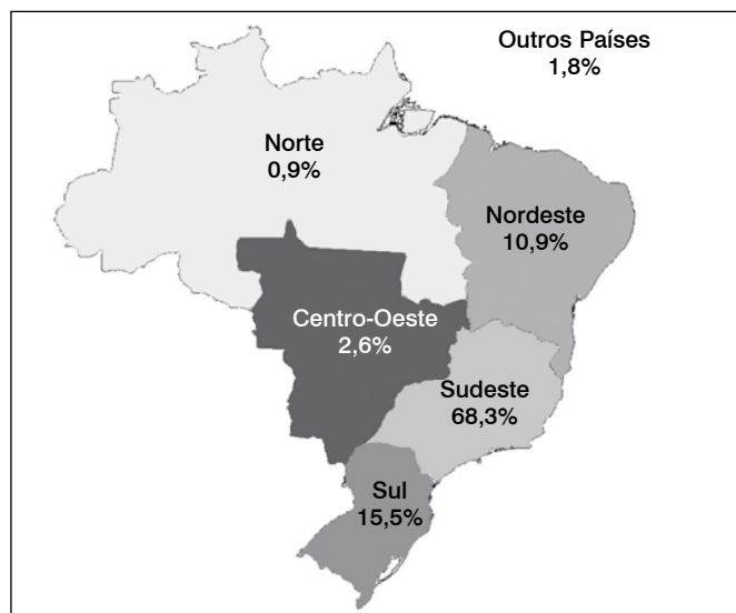
Figura 1. Trabalhos apresentados no CBOT.

Quatorze trabalhos foram encontrados nas duas bases de dados em duas revistas diferentes. Após uma análise mais aprofundada destes 14 artigos, vimos que cinco trabalhos foram publicados em revistas diferentes, pois tratavam de aspectos diferentes de um mesmo estudo, ou porque apresentavam uma casuística maior que o primeiro trabalho. Nove artigos publicados em revistas diferentes (uma nacional e outra estrangeira) eram extremamente semelhantes.