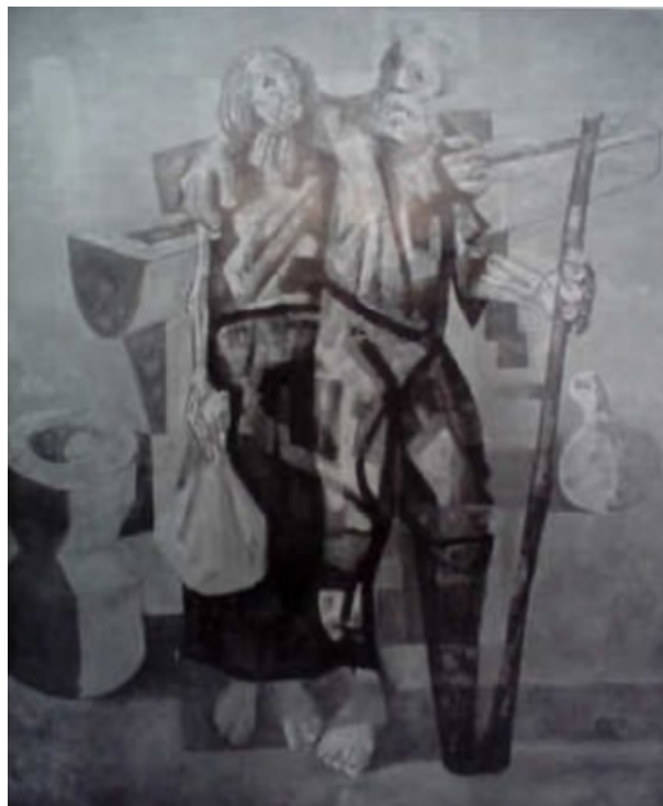
Figura 5. Candido Portinari, Vítimas da seca , 1945. Óleo sobre tela, 180 x 150 cm. Coleção particular, Rio de Janeiro.

Este tipo de iconografia, camuflada de denúncia sintética de uma realidade, traz consigo um potente papel político, ideológico, econômico e cultural: se articulada com maestria, delimita conceitos mascarados de verdade, sem, contudo, precisar recorrer a ela.