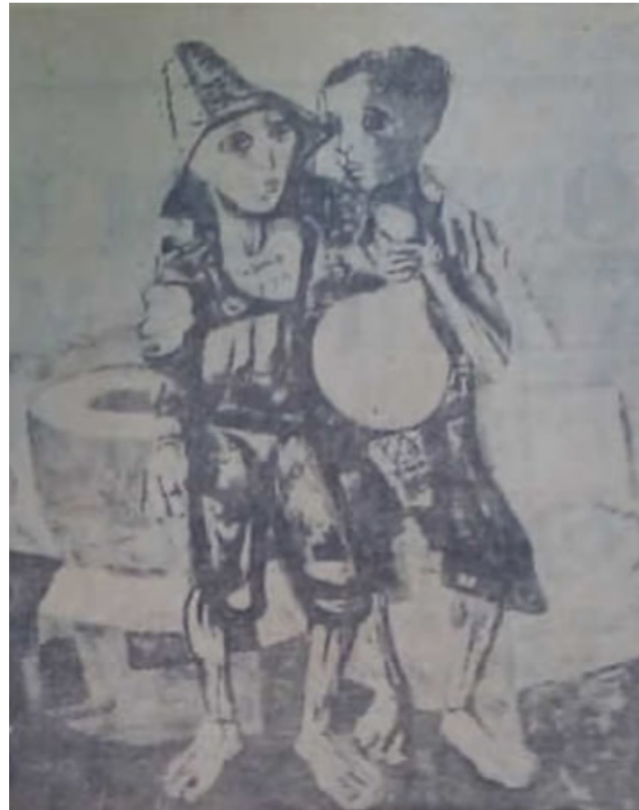
Figura 4. Candido Portinari, Meninos abraçados , 1945. Óleo sobre tela, 100 x 81 cm. Coleção particular, Rio de Janeiro.

Corroborando tal perspectiva, as únicas imagens reproduzidas pelas mídias da época são de autoria de Candido Portinari: Meninos abraçados , 1945 (Figura 4) e Vítimas da seca , 1945 (Figura 5). Tomando-as lado a lado, percebe-se o fetiche pelo símbolo da pobreza.