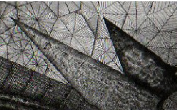
FIGURA 4. Joan Ponç, Suite Cabezas (detalle), 1958-1959. Lápiz y tinta china sobre papel, 50 x 70 cm. Colección particular.