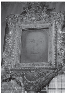
Figura 02. Imagem de Manoppello, Abruzzo, Itália.