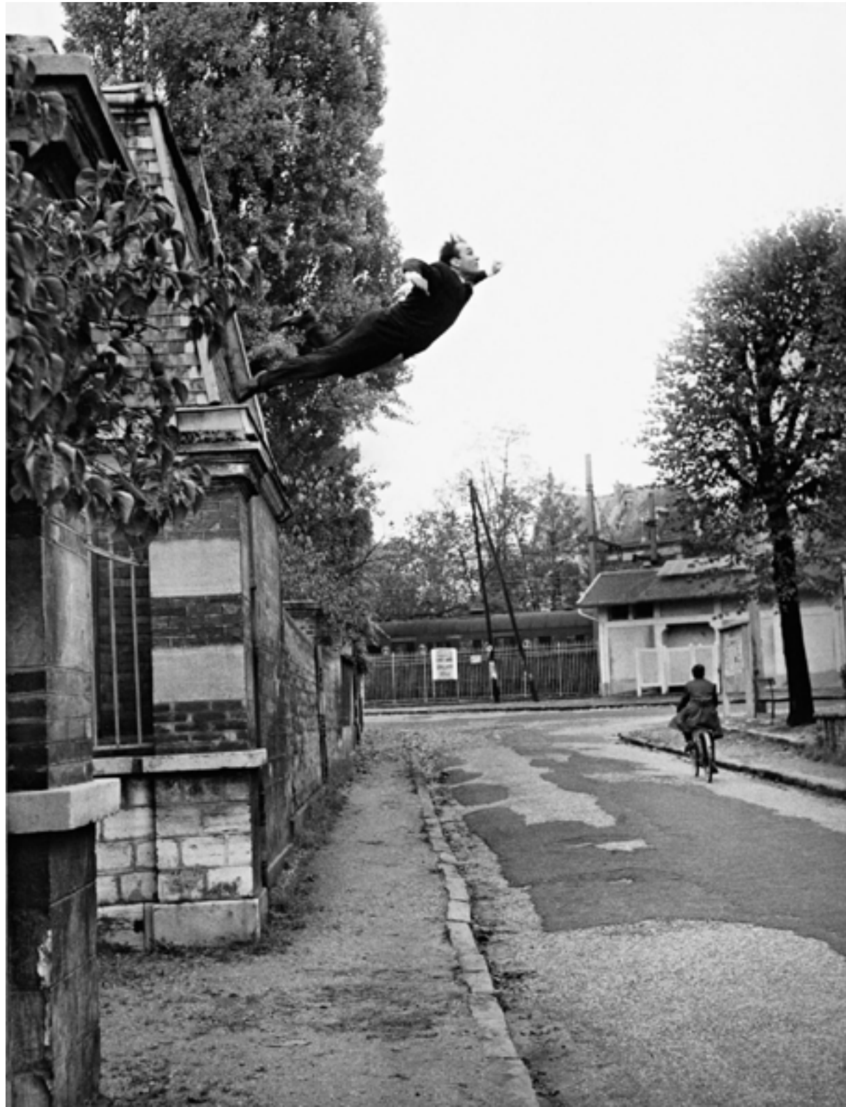
FIGURA 1 Yves Klein, Leap into the Void , 1960. Registro fotográfico, 25,9 x 20 cm. Fuente: Photo: © Harry Shunk and Janos Kender J.Paul Getty Trust. The Getty Research Institute, Los Angeles. (2014.R.20) © The Estate of Yves Klein c/o ADAGP, Paris.