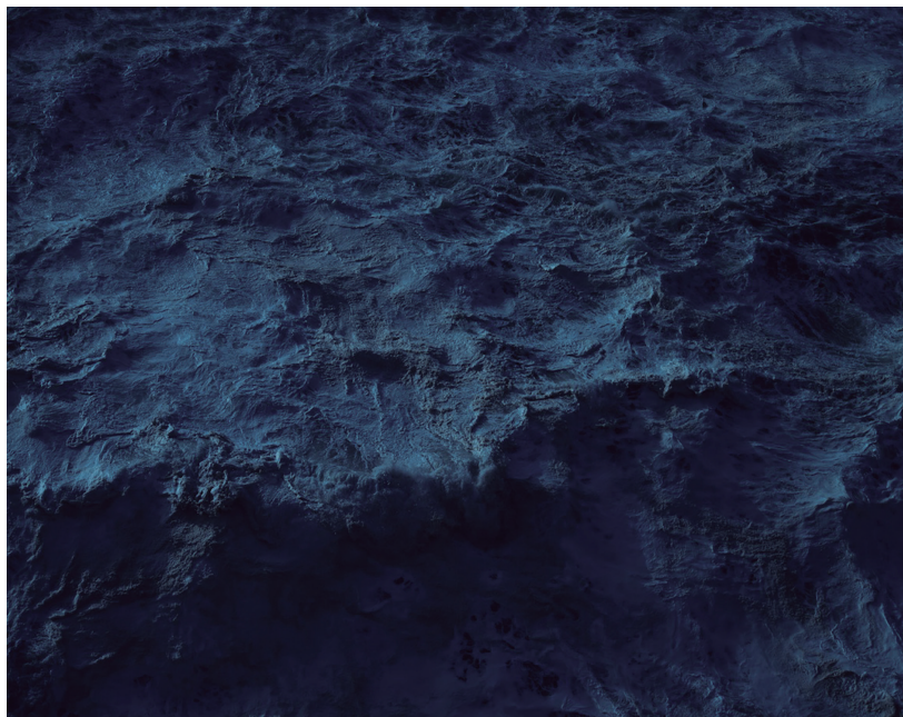
Fig. 1. Fotograma da videoinstalação Los durmientes [Enrique Ramirez, 2014].

Muito embora a obra videográfica de Ramirez seja vista sobretudo no contexto de exposições de arte, em museus e galerias, seu uso da imagem em movimento na busca por uma imagem que possa dizer a memória da catástrofe nos permite colocar seu trabalho em diálogo com a tradição de representação da catástrofe no cinema, em primeiro lugar no âmbito dos filmes de barragem e, em segundo lugar, num contexto mais amplo das tentativas de “capturar” o evento catastrófico pelo cinema desde o final do século XIX.