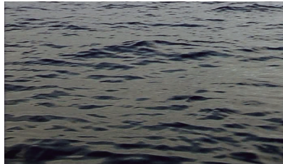
Figs. 2 e 3. Fotogramas de Déluge au pays du Baas (Omar Amiralay, 2002).