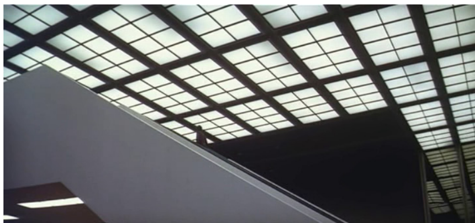
Figura 4: Still de A trama ( The Parallax View ), Alan J. Pakula, 1974.

Esse aspecto labiríntico do enredo corrobora uma atmosfera de thriller corporativo que perpassa a série e a aproxima, em alguns pontos, das ficções paranoicas da década de 1970, em que – como expressão visual do emaranhado de informações de que se compunham as narrativas – eram recorrentes os espaços arquitetônicos esquadrihados por grades geométricas, onde os corpos apareciam como insetos aprisionados numa teia. Westworld conta com um cenário desse tipo, que parece até decalcado de A trama ( The Parallax View , 1974), de Alan J. Pakula, um dos filmes mais representativos daquele ciclo de thriller paranoico dos anos 1970 (fig. 4 e 5).