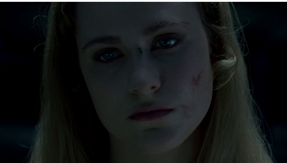
Figura 6: Still de Westworld (temporada 1, episódio 1), Lisa Joy e Jonathan Nolan, 2016.

No meio do travelling , ocorre uma suave fusão para um primeiro plano do rosto de Dolores, que permanece inerte, como uma máquina desligada de sua fonte de energia – tanto que não esboça qualquer reação quando uma mosca pousa em seu nariz (fig. 6).