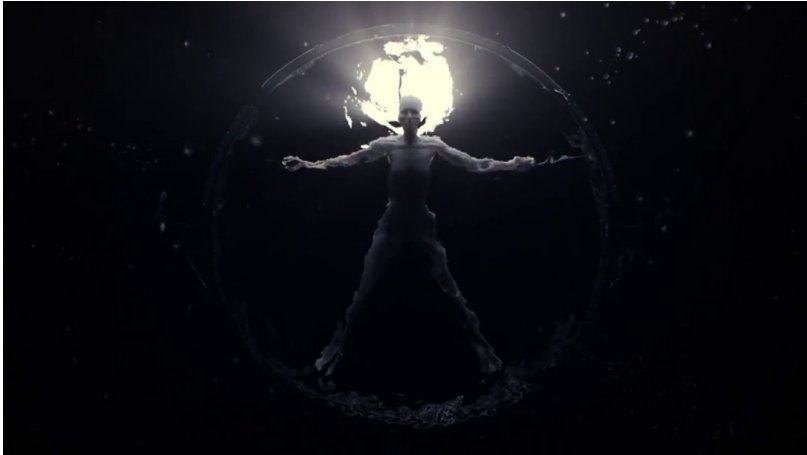
Figura 11: Imagem da vinheta de abertura de Westworld .

Essa imagem da vinheta, figura matricial da série, tem seu sentido explicitado na cena da segunda temporada em que Ford confessa para Bernard que considera os androides os legítimos herdeiros do mundo. Pouco importa, na opinião dele, que os robôs ocupem o lugar dos humanos. Isso deveria até ser encorajado. A postura do cientista, contudo, não é uma prova de humildade: se ele se desapegou do mundo e aceita entregá-lo às máquinas, é porque já não lhe basta ser o centro do universo sem ter sido seu criador, e sem ter as demais vantagens divinas, como a eternidade e a onipresença. O homem vitruviano, o cânone das proporções e das medidas, pode ser tranquilamente trocado por um androide, pois o humano está mais interessado em fazer o upgrade para a dimensão irrepresentável, invisível e incomensurável que um dia atribuiu a Deus. Trata-se, efetivamente, do fim do humanismo – mas tanto no sentido de prazo vencido como no de realização final