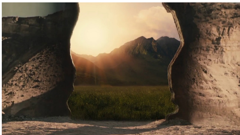
Figura 2: Still de Westworld (temporada 2, episódio 10), Lisa Joy e Jonathan Nolan, 2018.