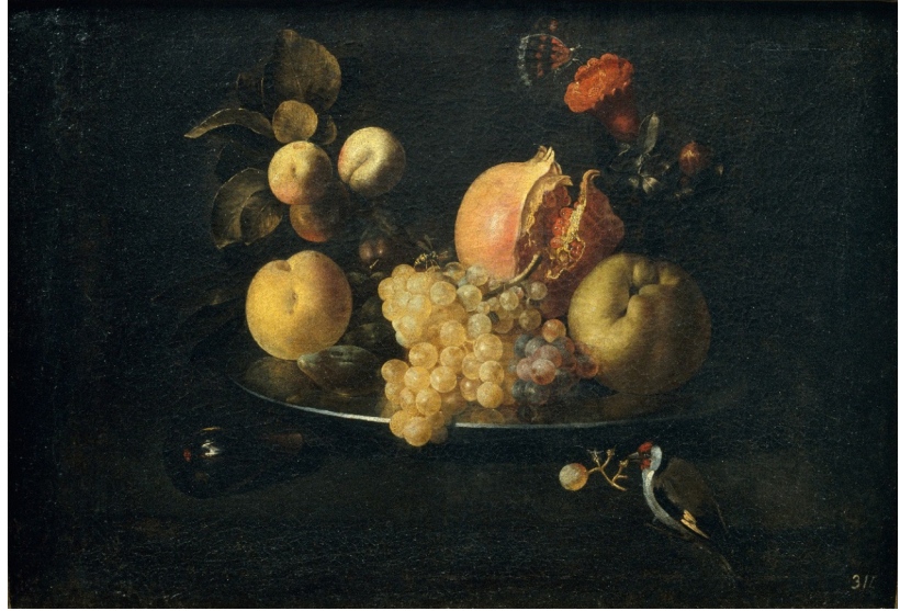
Figura 9: Juan de Zurbarán, Natureza morta com frutas e um pintassilgo , c.1640. Óleo sobre tela, 40 x 57 cm. Museu Nacional d'Art de Catalunya, Barcelona.

47. BRYSON, Norman. Looking at the overlooked: four essays on still life painting. Londres: Reaktion Books, 1990, p. 140. Tradução minha.