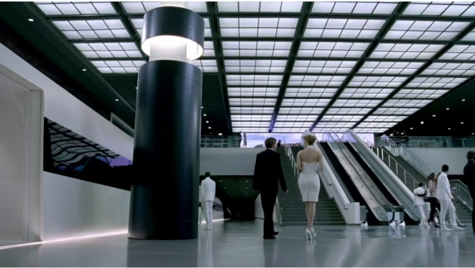
Figura 5: Still de Westworld (temporada 1, episódio 2), Lisa Joy e Jonathan Nolan, 2016.