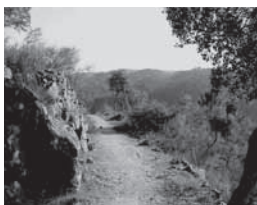
Figura 3 e 4: O “antes” e o “depois” da recuperação do Caminho da Fonte Velha . Detalhe, a escultura de chão , cabeça antropomórfica de Victor Ribeiro.