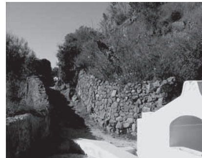
Figuras 16 e 17:

Pormenor da casa em ruínas (16) e a Fonte Velha recuperada (17).