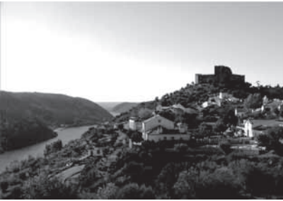
Figura 2: Vista panorâmica de Belver, com o castelo medieval em segundo plano.

Confrontada com esta problemática, a Câmara Municipal do Gavião optou claramente por rentabilizar os recursos naturais, paisagísticos e patrimoniais do seu concelho, que se situam sobretudo em Belver, apetrechando-o com um diversificado conjunto de equipamentos e de ações com finalidades de lazer e turismo. Esses equipamentos – tão diversos como uma praia fluvial, um hotel com atividades desportivas – e ações – como a reestruturação do largo da igreja e a intervenção de restauro do Caminho da Fonte Velha : um antiquíssimo caminho medieval que ligaria o centro da vila a uma das suas periferias rurais – foram suportadas, em parte, por projetos comunitários. Contaram com assessores técnicos e mediadores capazes de dar resposta a suas solicitações, através de concursos públicos. Daqui advém, como enunciaremos mais à frente, o início de uma forte intencionalidade e disposição programática por parte de quem tem o poder de decidir: os políticos (autarcas locais), logo seguidos pelos arquitetos e... pelos artistas (escultores).