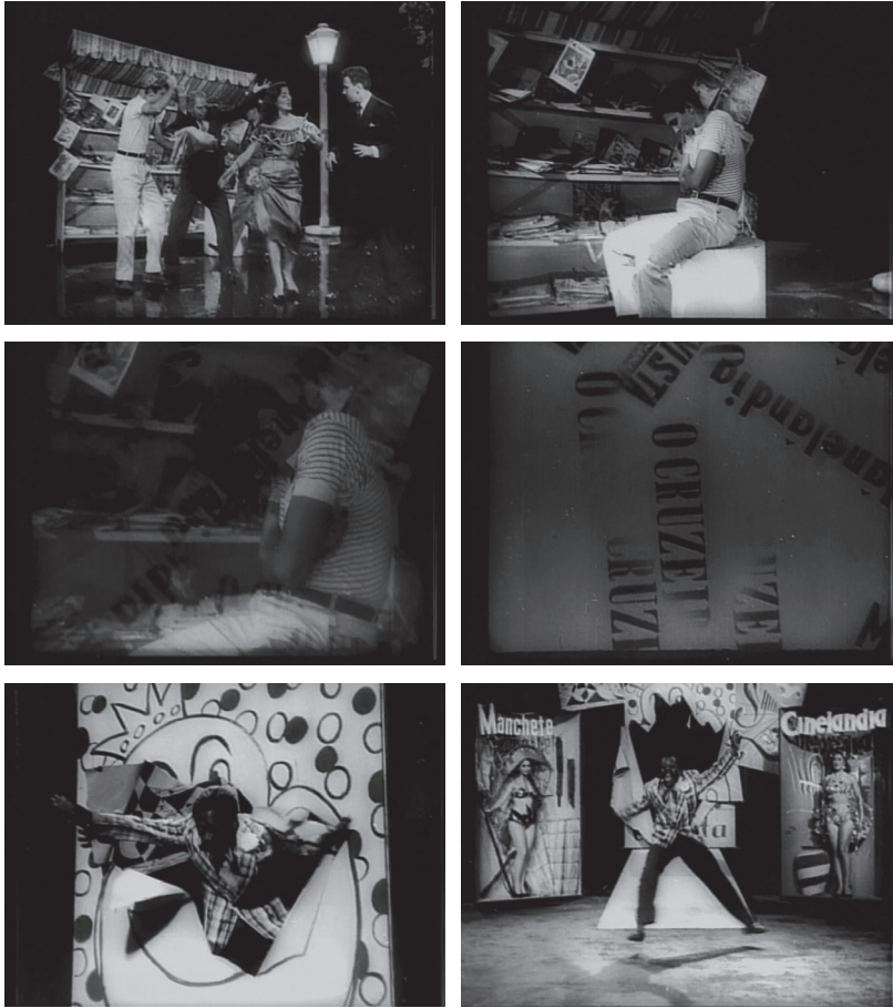
Figs. 6 a 11

Historiografia audiovisual: a história do cinema escrita pelos filmes