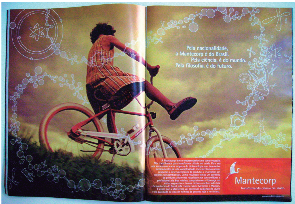
Figura 2: Publicidade da Mantecorp

Apesar dos resultados limitados e dos novos riscos implícitos na adoção de medidas deste tipo, seguimos acreditando que a ciência e a tecnologia são fontes seguras para a solução dos problemas ambientais. A publicidade explora estas ilusões sobre a possibilidade de respostas tecnológicas para problemas ambientais. As novidades tecnológicas são alardeadas pelas publicidades ambientais como grandes soluções e como motivos para a tranquilidade. Tomemos um exemplo.