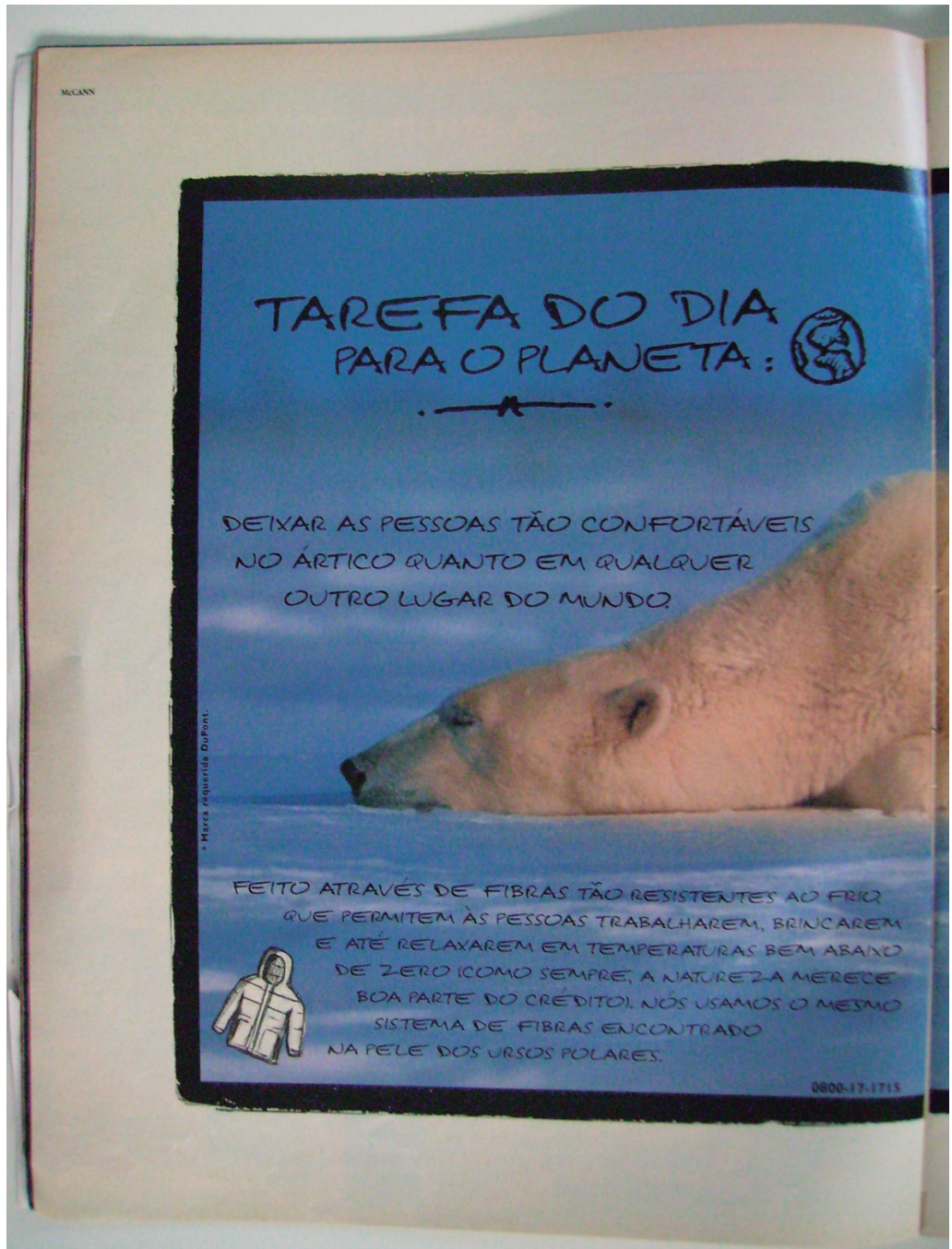
Figura 1: Detalhe da publicidade Dupont