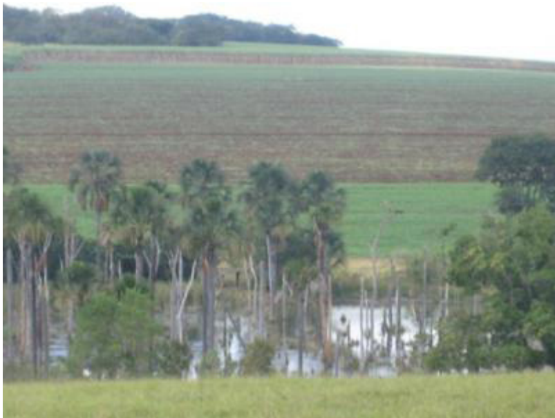
Foto 3: Ao fundo, área de reserva legal circundada por plantios de cana e em primeiro plano uma vereda (área de preservação permanente) invadida pela monocultura canavieira. Município de Água Cumprida, Triângulo Mineiro. Fonte: Foto do autor, 17/05/2010.

Fotos 1 e 2: Cana queimada para possibilitar o corte manual e gado em pastagens extensivas com novos plantios de cana ao fundo e fumaça de queimada acima à direita. Municípios de Capinópolis e Uberaba, Triângulo Mineiro. Fonte: Fotos do autor, 10/05/2010.