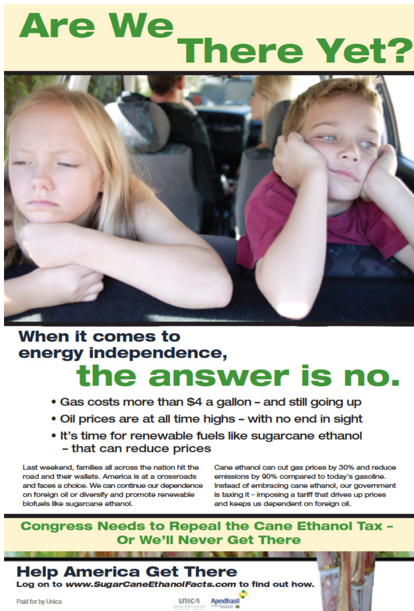
Imagem publicitária 3: Anúncio UNICA no mercado estadunidense