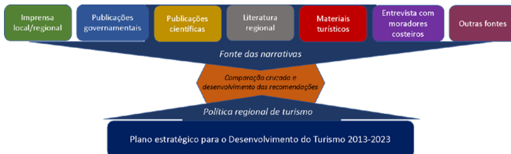
Figura 2 - Quadro principal de análise e fontes narrativas.

A presente análise seguiu três etapas principais (Figura 2): 1) Construção e classificação das narrativas, 2) Comparação cruzada entre o PEDT e as narrativas e 3) Recomendações para políticas futuras baseadas nos resultados das etapas 1 e 2.