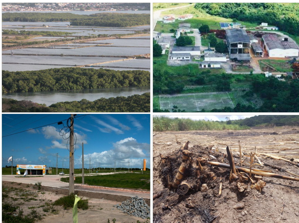
Figura 3. Empreendimentos na área do estudo

a) Tanques de criação de camarão; b) Fábrica da Oxinor; c) Condomínios residenciais; d) Cultivo de cana-de-açúcar.