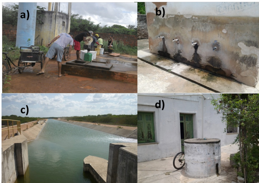
Figura 2: Identificação de algumas das fontes de água da comunidade de Cristais: a) cisterna coletiva; b) chafariz; c) canal da Integração; d) reservatório de água de chuva

Vale ressaltar que o estudo em questão é parte de uma das avaliações do Projeto Democratização da Governança dos Serviços de Água e Esgotos por Meio de Inovações Sociotécnicas (DESAFIO) iv . Neste contexto, a definição da comunidade de Cristais considerou a avaliação posterior à implantação e operação de um SAA, por meio de um modelo de gestão em saneamento rural. A escolha também levou em conta o fato de a comunidade estar próxima de receber um SAA, o número de famílias residentes e a proximidade de outra comunidade usada como controle, com características semelhantes, mas com um SAA já existente.