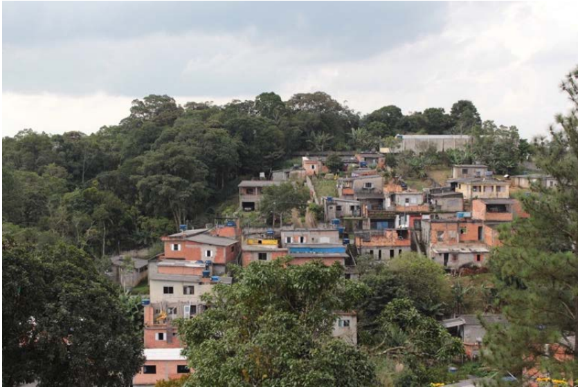
Figura 1 – Jardim Nova América, Parelheiros