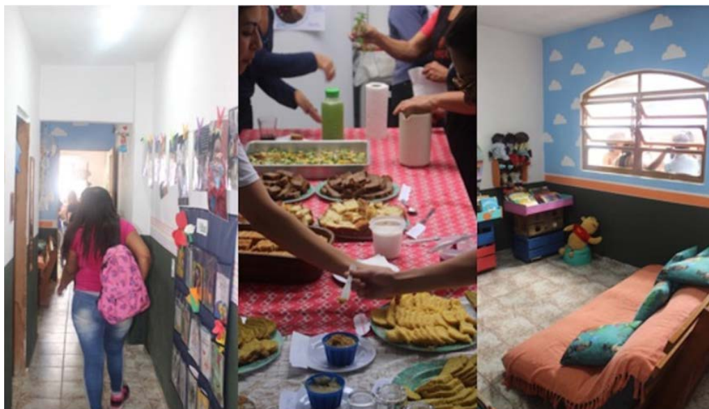
Figura 4: Casa das Histórias