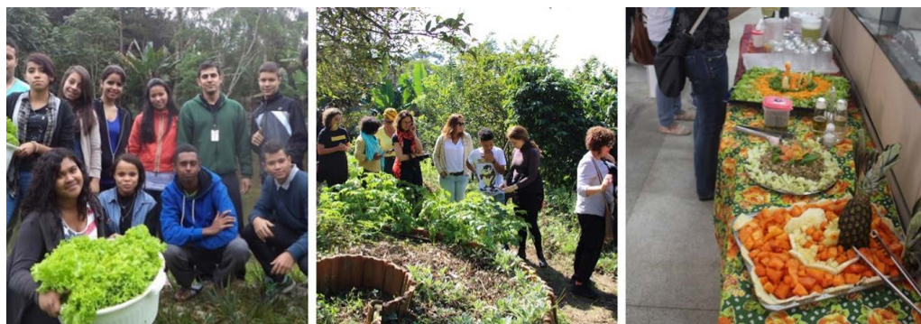
Figura 3 - Cozinha Amara e Projeto Vargem Grande Saudável