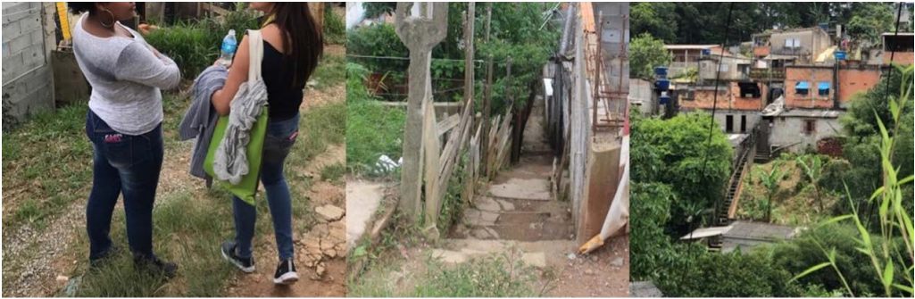
Figura 2 - Duas mães mobilizadoras e aspectos dos trajetos que percorrem