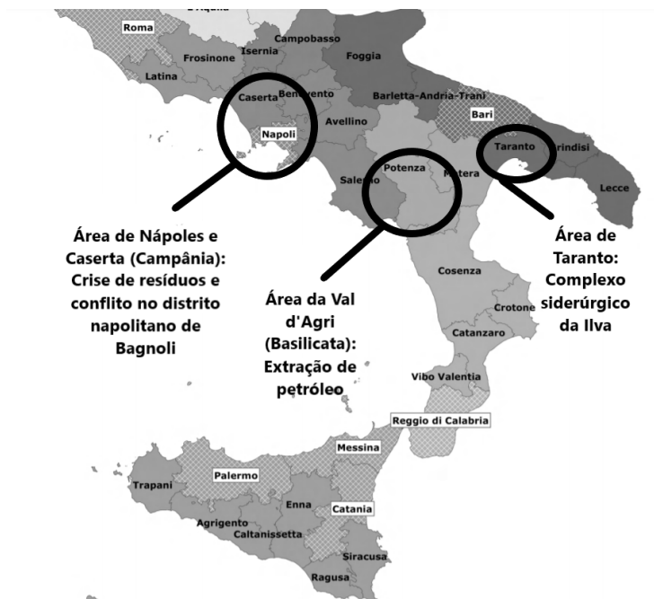
Figura 3 – Mapa das províncias do sul da Itália. Em evidência as áreas dos conflitos socioambientais tratados neste ensaio