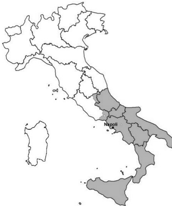
Figura 1 – Mapa do território do Reino das Duas Sicílias (1815) comparado com as atuais regiões italianas