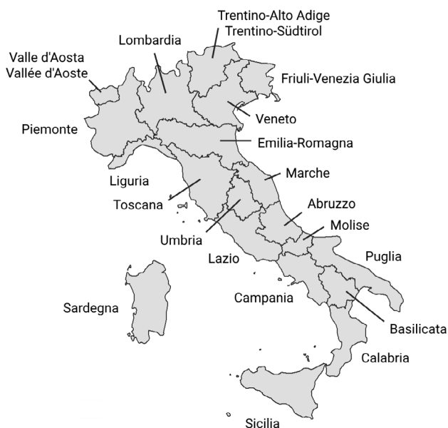
Figura 2 – Mapa das regiões italianas atuais