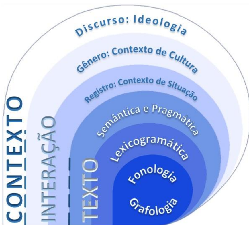
Fig.1 – Articulação das concepções de discurso como texto, interação e contexto (FAIRCLOUGH, 1989, p.25) e de linguagem como sistema sociosemiótico (MARTIN, 1992, p.496) (MOTTA-ROTH, 2008, p.355).

interpretação do texto). Ela representa a instanciação fonológica ou grafológica do léxico e da gramática, do registro e do gênero, até o discurso – visões particulares formuladas na linguagem em uso (FAIRCLOUGH, 2003). Cada círculo concêntrico engloba os círculos menores e assim subsequentemente (MARTIN, 1992, p.496), em unidades cada vez mais abrangentes. O contexto é constituído pelos planos comunicativos da fonologia ao discurso, em um gênero específico a uma situação de comunicação recorrente e institucionalizada na cultura de um grupo social (HALLIDAY, 1978, p.145), como um feixe de significados articulados em estágios e orientados para o objetivo de realizar práticas sociais (MARTIN, 2002, p.269).