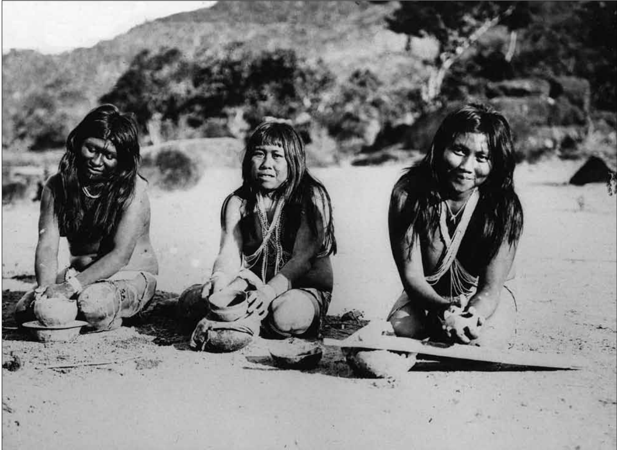
Figura 7. Nachlass Theodor Koch-Grünberg, Völkerkundliche Sammlung der Philipps-Universität Marburg/Lgado Científico de Theodor Koch-Grünberg, Coleção Etnográfica da Universidade Philipps de Marburg. Inventarnummer/Número de inventário: KG-H-III, 196d.

publicou posteriormente em duas obras que denominou "Typenatlas" ("Atlas de tipos" indígenas), categoria estranha de publicação (sem análise nem comentários, além de não ter paralelo em outros autores). No caso da expedição de 1903-1905 ao alto rio Negro, Koch-Grünberg publicou este atlas em separado, enquanto em "Vom Roraima zum Orinoco", ele constitui o volume cinco.