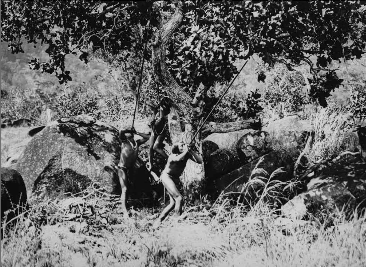
Figura 4. Nachlass Theodor Koch-Grünberg, Völkerkundliche Sammlung der Philipps-Universität Marburg/Legado Científico de Theodor Koch-Grünberg, Coleção Etnográfica da Universidade Philipps de Marburg. Inventarnummer/Número de inventário: KG-H-III, 197d.

com a qual elas acabaram reproduzidas nas publicações do autor 24 ) é pouco clara. Afinal, por que tantas fotos de índios totalmente 'desindividualizados'? E, mais ainda, por que tantas fotos de objetos que, afinal, acabaram, em sua