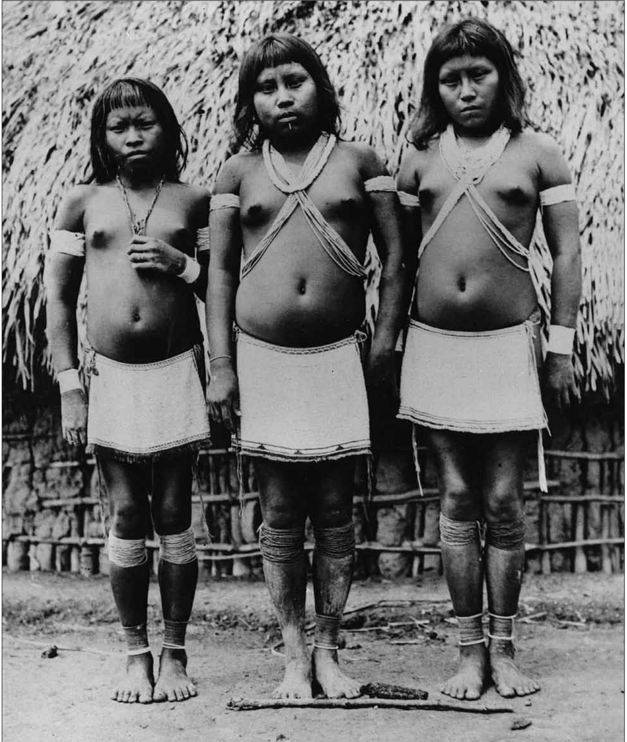
Figura 2. Nachlass Theodor Koch-Grünberg, Völkerkundliche Sammlung der Philipps-Universität Marburg/Legado Científico de Theodor Koch-Grünberg, Coleção Etnográfica da Universidade Philipps de Marburg. Inventarnummer/Número de inventário: KG-H-III,192d.