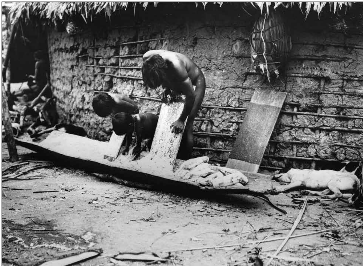
Figura 3. Inventarnummer/Número de inventário: KG-H-III,71d.

um grupo de visitantes, a 'família do tuxaua (ou chefe) X' ou, ainda, pequenos grupos de homens e mulheres (com maior frequência, crianças) claramente agrupados para serem fotografados em ambientes 'naturais': alguma paisagem ou à frente de uma casa (Figuras 5 e 6).