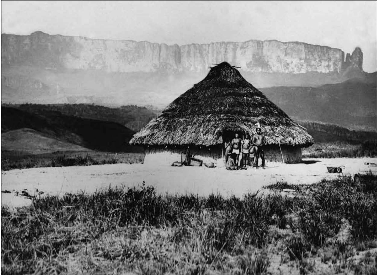
Figura 5. Nachlass Theodor Koch-Grünberg, Völkerkundliche Sammlung der Philipps-Universität Marburg/Legado Científico de Theodor Koch-Grünberg, Coleção Etnográfica da Universidade Philipps de Marburg. Inventarnummer/Número de inventário: KG-H-III,40.

anônimas, fotografadas de frente e de perfil sobre um fundo neutro), não cabe dúvida de que as fotografias foram tomadas (e massivamente reproduzidas nas duas grandes monografias) como contribuição do autor à antropologia física.