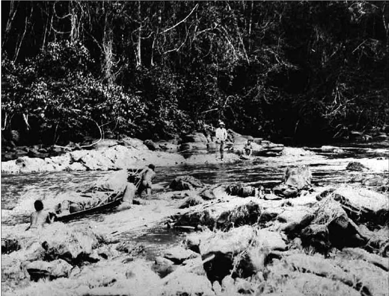
Figura 1. Nachlass Theodor Koch-Grünberg, Völkerkundliche Sammlung der Philipps-Universität Marburg/Legado Científico de Theodor Koch-Grünberg, Coleção Etnográfica da Universidade Philipps de Marburg. Inventarnummer/Número de inventário: KG-H-III,104d.

frequência, o próprio fotógrafo, a sós ou rodeado por indígenas. Nestes casos, trata-se, obviamente, de mostrar tipos de interação etnográfica, como: ‘índios viajando com o etnógrafo [carregando a sua equipagem]’; ‘índios observando o etnógrafo trabalhar’; ‘índios informando’ etc 19 . Mas, não há dúvida, ilustrar paisagens ou o nativo no seu contexto natural não era o interesse principal deste etnógrafo