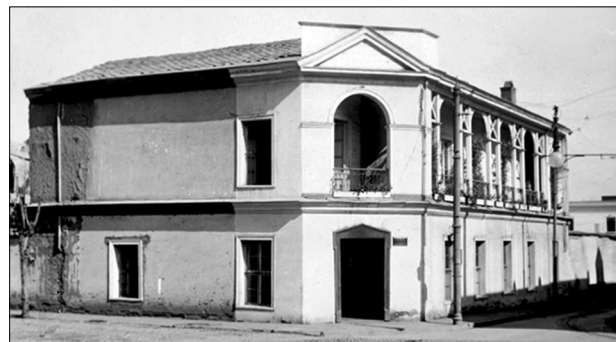
Figura 3. Museo de Etnología y Antropología hacia 1916.