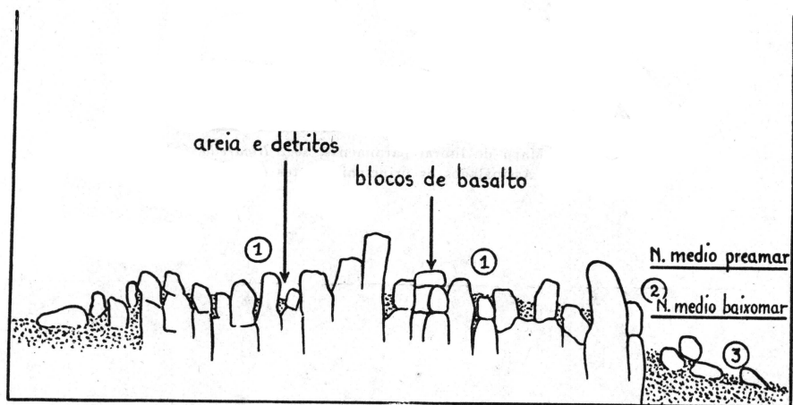
Fig. 3. — Esquema da distribuição de algas nos rochedos abrigados entre a Ilha do Farol e o Morro de Caiobá. 4-11-1950.