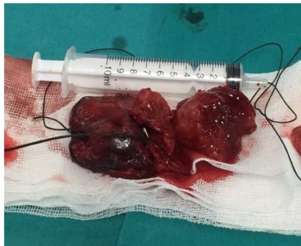
Figura 3 Aspecto macroscópico do tumor.

As complicações após as cirurgias também foram registradas. Paralisia facial foi observada em 2 (1,9%) pacientes,