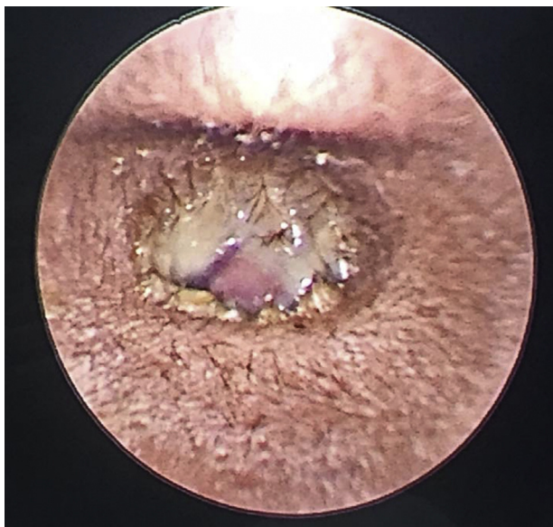
Figura 1 Massa polipoide que obstrui o canal auditivo esquerdo.

paralisia do neurônio motor inferior grau III de House Brackmann, pois havia paresia da região nasolabial esquerda e inclinação do ângulo esquerdo do lábio. A otoscopia mostrava uma massa polipoide que ocluía todo o meato acústico externo esquerdo, coberta por otorreia sanguinolenta e fétida (fig. 1). O exame do lado direito estava normal, com membrana timpânica intacta. O exame da orofaringe estava normal e não havia nódulos palpáveis no pescoço. A nasendoscopia revelou leve aumento da adenoide, sem sinais de infecção ativa. Todos os outros nervos cranianos estavam funcionantes e não havia evidência de outro déficit neurológico. O exame sistêmico não apresentava nada digno de nota. O teste com diapasão revelou perda auditiva condutiva esquerda. Hemograma completo e eletrólitos estavam dentro dos parâmetros de normalidade. Foi feito diagnóstico preliminar de pólipos aurais esquerdo com paralisia do nervo facial grau III, além de uma suspeita de colesteatoma de meato acústico externo. O paciente iniciou tratamento com ciprofloxacina intravenosa, com dose decrescente de prednisona. No dia seguinte, observou-se melhoria na paralisia do nervo facial, que apresentou grau II de House Brackman.