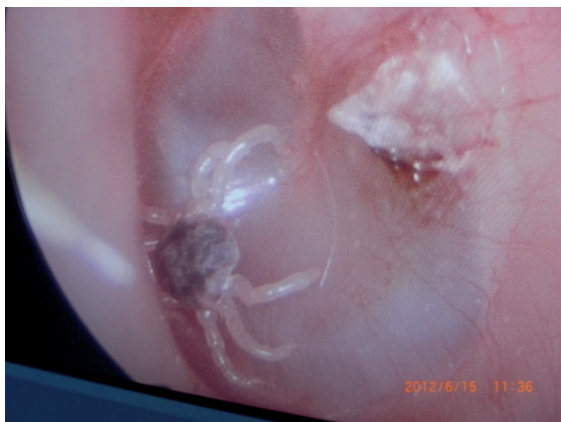
Figura 1 Carrapato no tímpano.