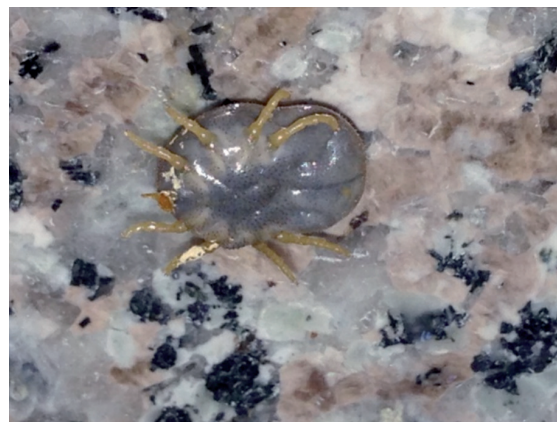
Figura 3 Carrapato removido da orelha.