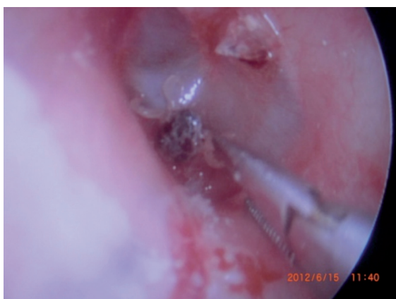
Figura 2 Remoção do carrapato com pinça-jacaré, sob visualização endoscópica.