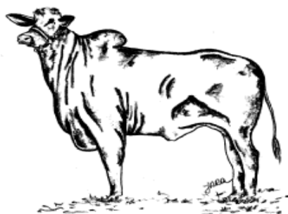
Figura 1 Representação esquemática das medidas corpóreas sendo 1-2, comprimento de corpo; 3-4, altura de cernelha e 5 perímetro torácico, mensuradas em novilhas e vacas